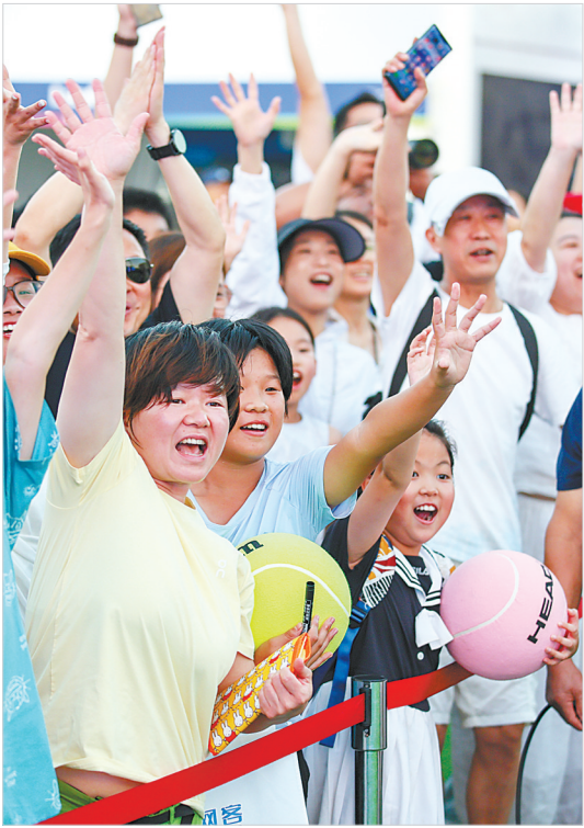
球迷等待球星送出签名网球。