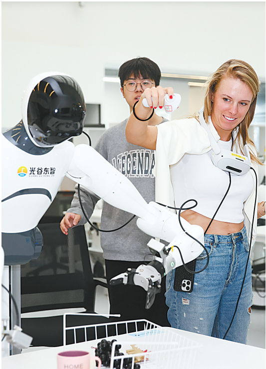
武网球星与人形机器人互动。