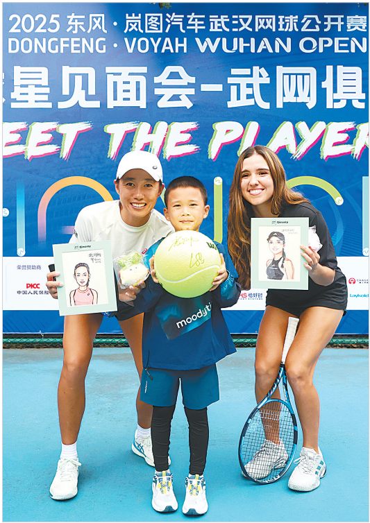
武网球星见面会。