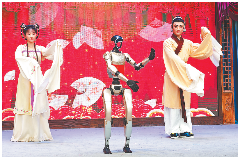
在黄梅县东山镇梅村的大戏台上,智能机器人与黄梅戏演员同台表演黄梅戏。

湖北日报讯(记者王理略、曹雯、通讯员郭文彬、张志林、吴慕枫)“从没想到机器人能唱出这么地道的黄梅戏!”10月2日,黄梅县东山镇梅村,来自江西的游客李女士惊喜地说,机器人一亮嗓,孩子立刻被吸引住了。“十一”假期第二天,湖北省文旅市场持续释放活力,全省“文旅+”新产品密集涌现,夜间文旅消费场景不断丰富,以创新体验与多元活动点燃游客出行热情,为假日文旅经济注入强劲新动能。