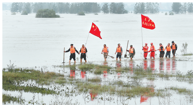
钟祥市柴湖镇汉江大堤沿线,由党员干部、民警和民兵组成的应急分队开展拉网式排查。

湖北日报讯(记者祝华、通讯员李慧敏、赵平、刘俊杰)受华西秋雨影响,汉江中下游水位持续上涨。10月2日8时,汉江荆门段128.3公里堤防超设防水位。钟祥皇庄水文站水位47.41米,超设防水位0.41米。