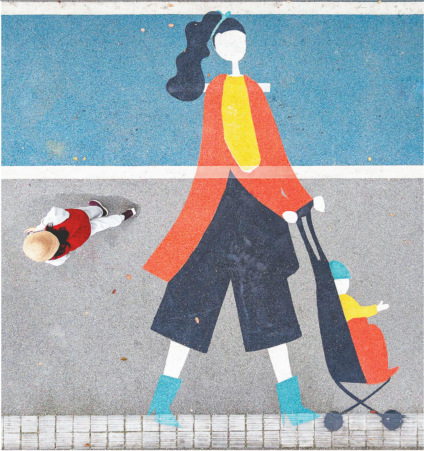
陈嘉丽《健身步道》(组照)