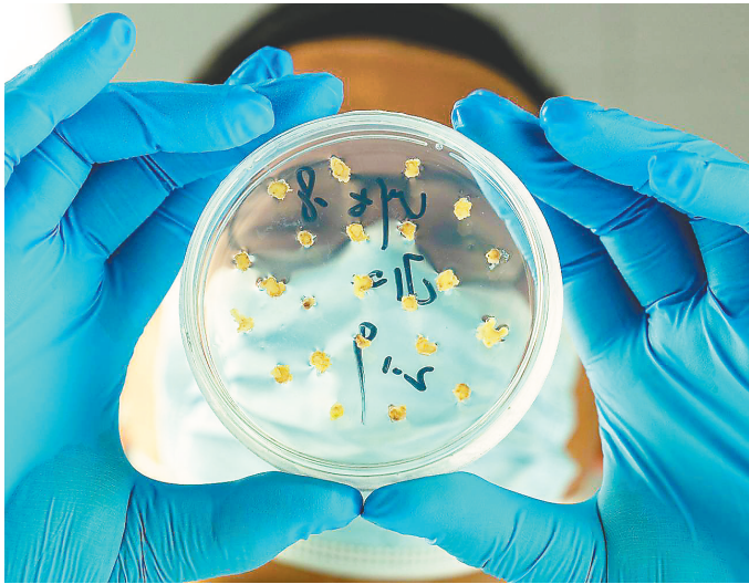
陈国兴《钱基粮芯》(组照)