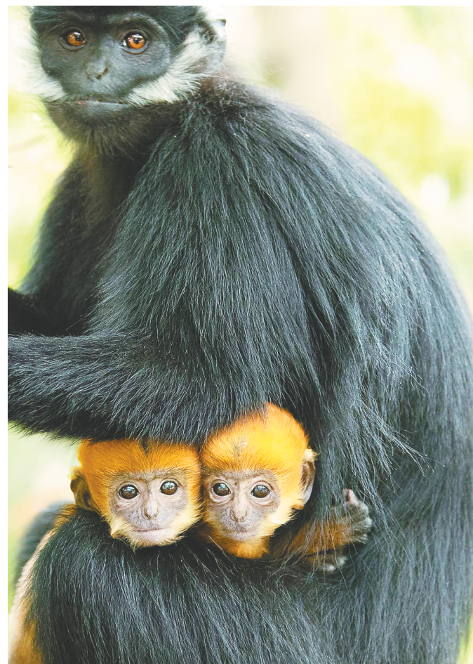
李莉莉《大山里的精灵》(组照)