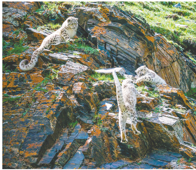
雷佳民《长江源头之雪豹》(组照)