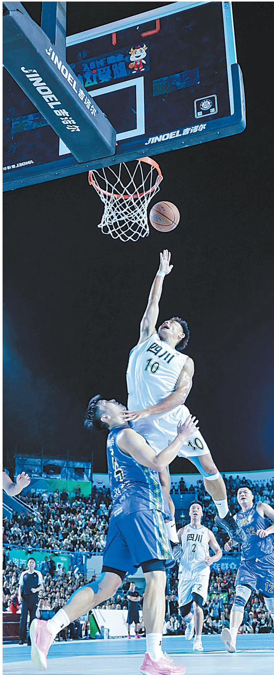
比赛现场的激烈拼抢。

近年来，咸丰县积极推进体育设施建设，在各村（社区）建成文体广场、健身中心、篮球场等场地，为“村BA”等赛事打下基础。赛事期间，小模村体育公园成为欢乐的海洋。场外，农特产品展销、非遗体验、农趣嘉年华等活动同步开展，一场融合“农、文、体、旅”的乡村盛会正悄然成形。