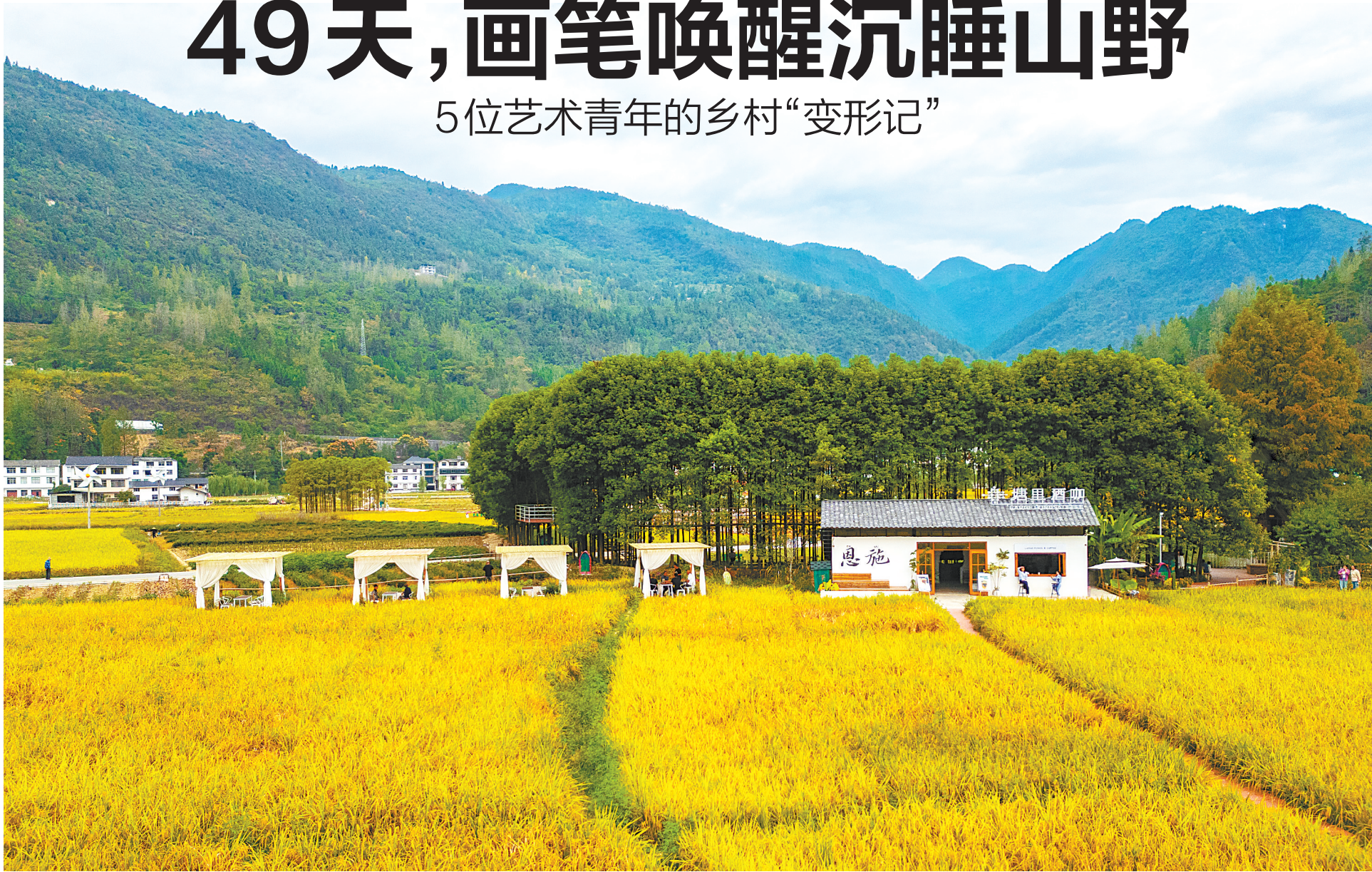
俯瞰恩施市白果乡下村坝村塘里堂外。