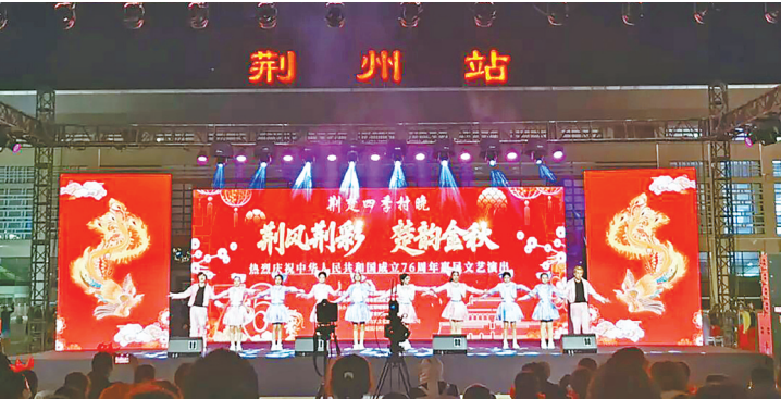
9月19日晚，荆州区文旅局在荆州火车站举办惠民文艺演出。

宙艺术馆推出三大沉浸式项目，荆街数字文博馆“灵境深墟”开启数字探险；荆州园博园将AI机器人互动、国风巡游、非遗手作与大