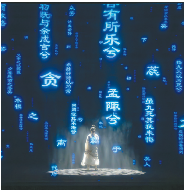
荆州方特屈原表演。

荆州是楚文化的“根”与“魂”,这里的每一块古砖、每一条古街,都是解读中国古代文明的钥匙,也是当代人传承文化基因的重要载体。