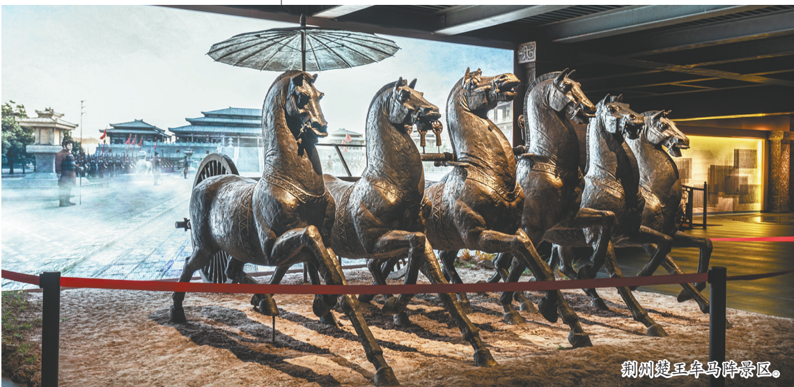
荆州楚王车马阵景区。