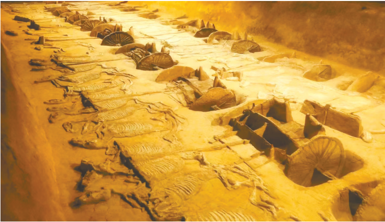
楚王车马阵一号坑倒彩。

“让收藏在博物馆里的文物、陈列在广阔大地上的遗产、书写在古籍里的文字都活起来”,这是文化遗产的时代命题。