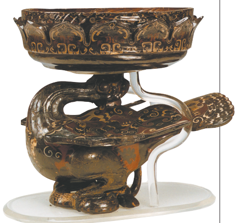
战国凤鸟莲花豆(修复后)。