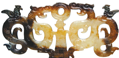
镂空玉人龙鸟佩——荆州博物馆藏品(国家一级文物)。

随着大量文物、遗址被发掘,荆州逐渐成为探索楚文化的学术中心。“灿烂楚文化,鼎盛在中心”“荆州是中国楚文化的中心”……近年来,来自世界各地的楚文化专家在荆州举办多场学术研讨会,共同探讨楚文化的渊源与流变,探寻楚文化的发展之道,也为楚文化的海外传播和推广提供了有力支持。