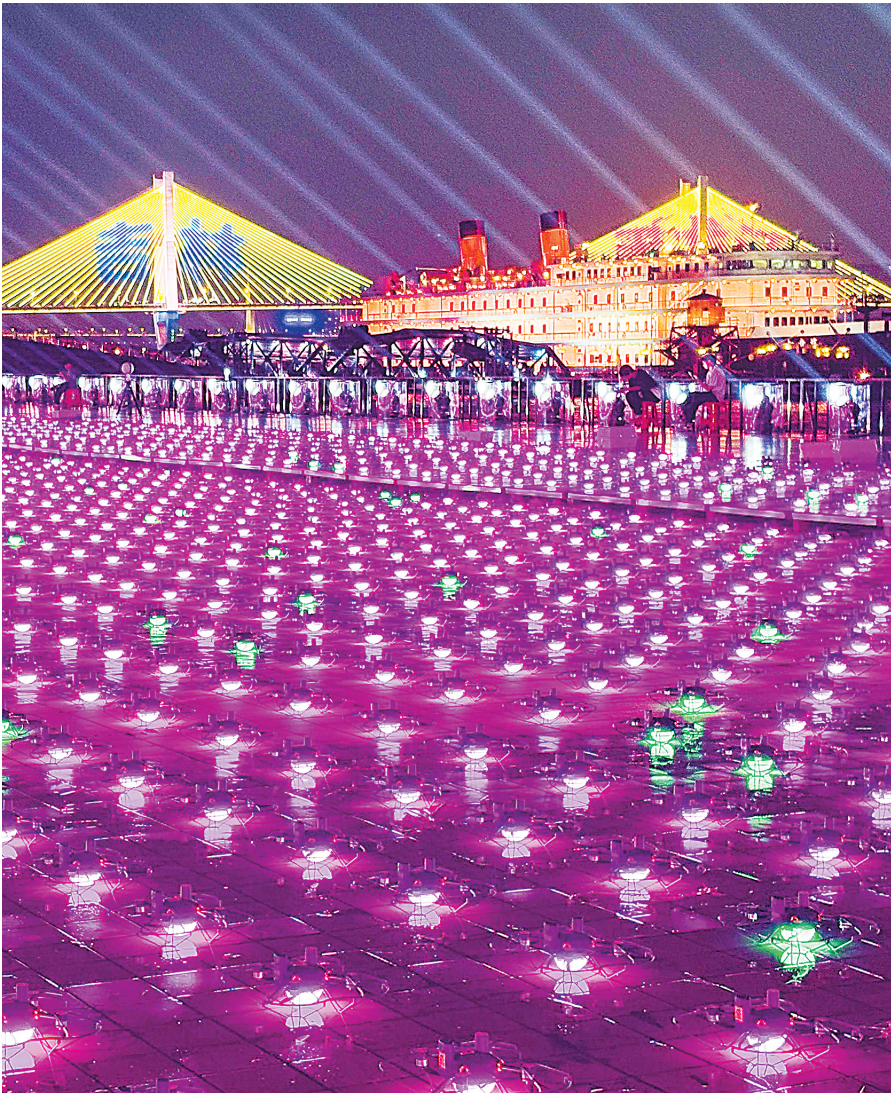
无人机调试待飞。