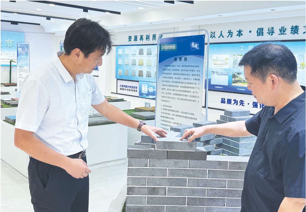
武汉农村商业银行工作人员(左)深入企业宣传“三类信用价值”贷款激发市场主体活力。

截至目前,武汉农商行“鑫知贷”已累计实现授信规模超31.5亿元,支持科技型企业247户。“鑫知贷”的实践探索,体现了新形势下知识价值信用贷款的适用性。武汉农商行充分依托政银数据协同与政策工具创新,推动知识价值信用贷款逐渐向标准化、规模化发展,加速探索适配科技型企业的创新产品与高效服务,让更多技术领先的科技型企业实现资本领先,使金融活水真正成为激活新质生产力的关键变量,助力湖北加速打造具有全国影响力的科技创新高地。