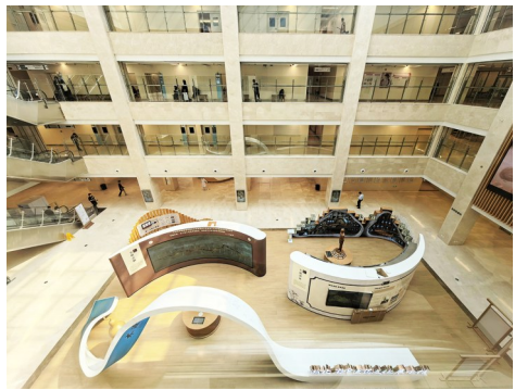
湖北省中医药文化展示馆今年在湖北省中医院开馆。

在科室早期形成的标准操作规程基础上，通过多轮专家咨询和论证，最终形成了《阴阳调理灸技术操作规范》，并于2022年经湖北省中医药学会和湖北省针灸学会联合发布。这份规范不仅对技术的操作过程进行规范化和标准化统一，而且详细阐述了具体的6大灸法种类、作用和适应病症。