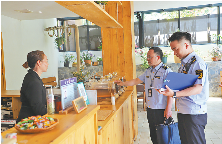
恩施大峡谷市场监管人员到民宿进行日常提示。

多次座谈后,企业修改平台退房政策,投诉量骤降。从信用赋能到标准引领,从创新执法到前置服务,湖北基层市场监管所以毛细血管般的细致触角,筑牢文旅消费环境的基石。这些奋斗在一线、创新在当下的文旅守护者,是游客放心“种草”荆山楚水的底气。