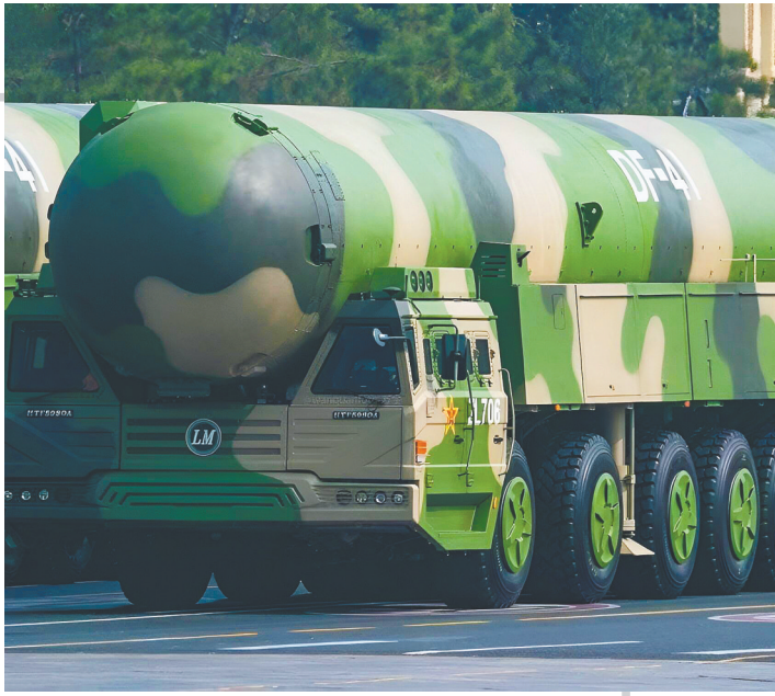
东风-41洲际弹道导弹。