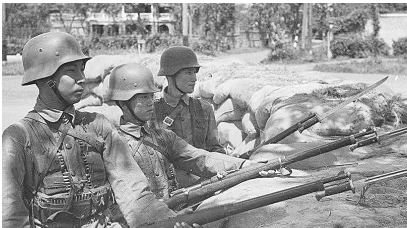
抗战中手持汉阳造步枪的中国士兵。