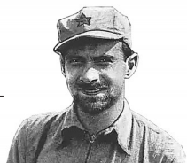
埃德加·斯诺 (1905年—1972年) 美国作家、新闻记者

以史为鉴,从抗战烽火到百年变局,世界各国人民都会选择站在历史正确一边、站在公平正义一边,坚定做历史记忆的守护者、发展振兴的同行者、国际公平正义的捍卫者,坚决反对一切形式的霸权主义和强权政治,共同创造人类更加美好的未来。