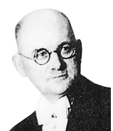
约翰·拉贝 (1882年—1950年) 德国友好人士