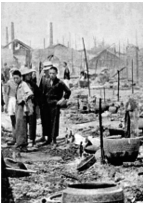
罗伯特·卡帕拍摄的汉口遭受日军飞机轰炸后的照片,刊载于1938年10月17日美国《生活》周刊。(资料图片)