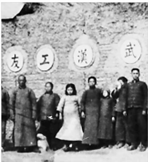
路易·艾黎等国际友人在中国建立了近3000个工业合作社。图为武汉工友弹棉花合作社。(资料图片)