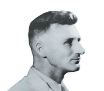
路易·艾黎 (1897年—1987年) 新西兰友好人士