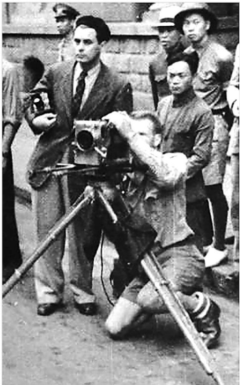
1938年,匈牙利裔美籍战地摄影大师罗伯特·卡帕与荷兰电影导演伊文思、摄影师费诺在汉口街头拍摄。(资料图片)