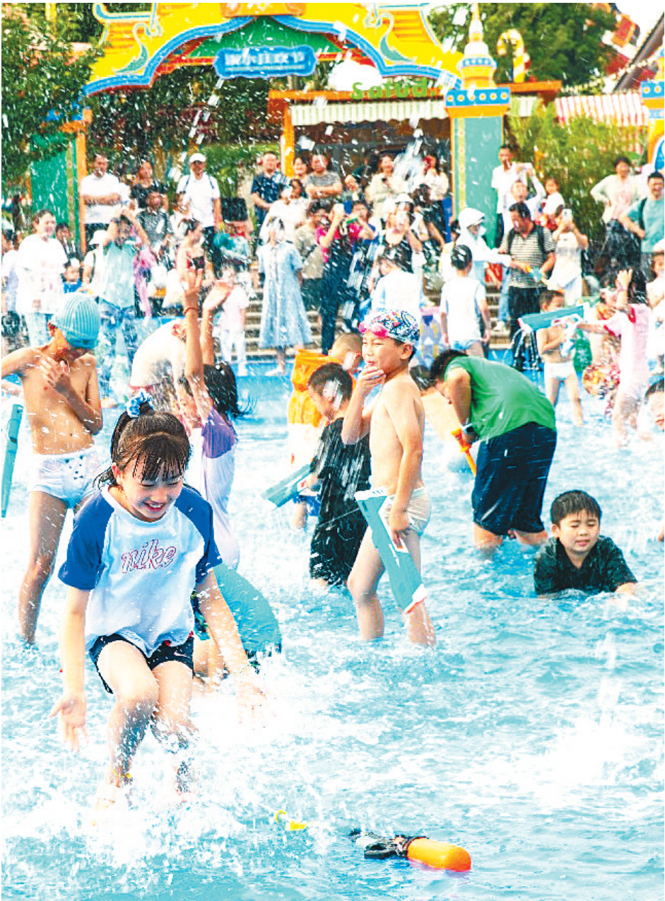
荆州亲水消暑旅游项目吸引了众多游客。

如今，千年古城的夏夜，被文旅消费的热浪浸染出崭新光晕。 暑期是文旅的黄金窗口期。荆州推出“荆彩夏日 惠游荆州”活动，其中惠民政策包括：发行荆州方特、荆州古城、楚王车马阵三大景区联票，票价299元；面向2025级荆州高校新生发放“文旅体验卡”，可免费游览全市A级景区；对旅行社组织包含2个及以上核心景区的旅游线路给予政策补贴。 荆州市文旅局数据显示：三大景区联票售出15万套，450万元消费补贴撬动3.2亿元市场增量。 此外，一些小细节也颇为暖心：荆州博物馆延长开放时间并增设休息区藤椅、直饮水点和防暑药品；荆州古城景区在宾阳楼步道安装喷雾降温设备，并在城楼区域放置冰块辅助降温；全市28家A级景区提供行李寄存服务；同时开放中心城区137个纳凉点。 当宾阳楼的雾化系统喷出彩虹，当电音节的水幕映出楚凤纹样，当小龙虾红油在漆器餐盘里荡漾——这座穿越千年历史的古城，正展现城市的活力与“荆”彩。