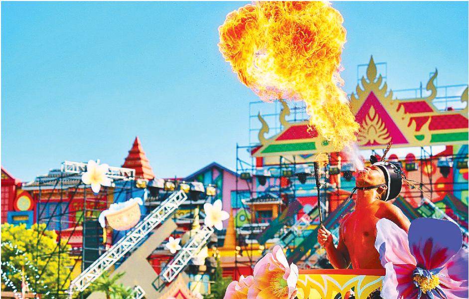
荆州方特的演职人员为游客表演节目。