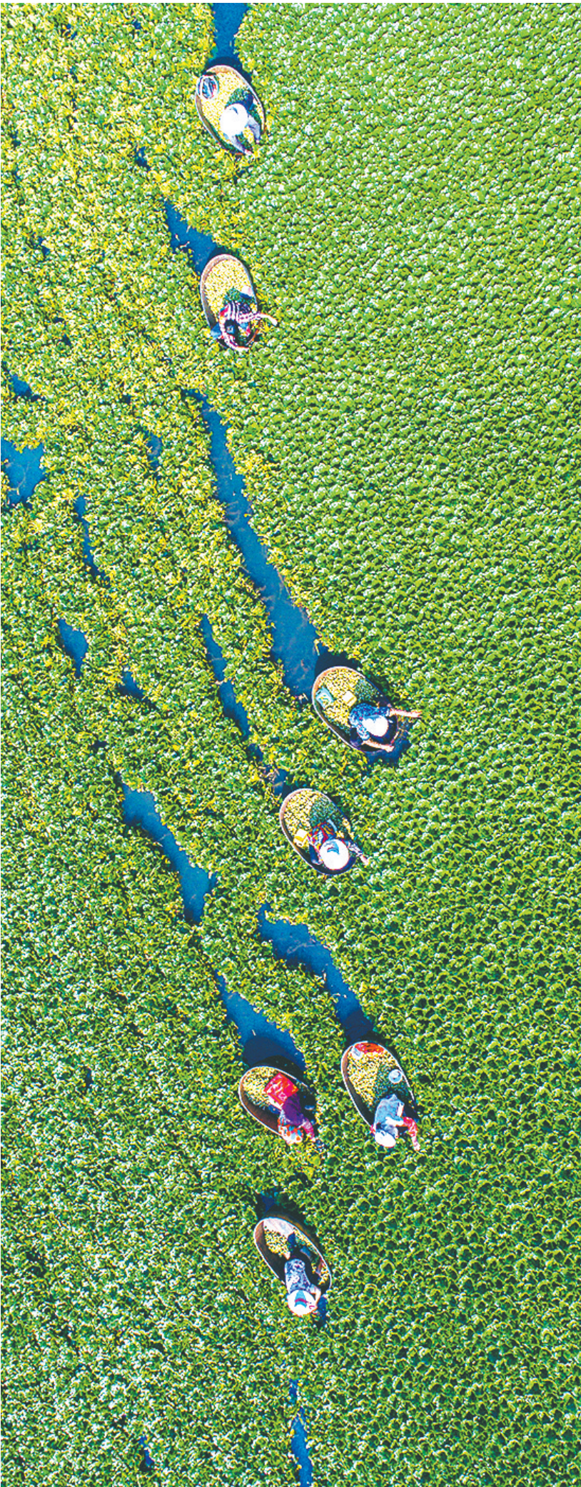
在“85后”回乡能人张剑雄的带领下，天井湖村种植了6000亩菱角。

其三，打破年龄、资历等隐性壁垒，以发展实效和群众公认为标准，敢于将年轻有为的产业带头人推上领导岗位，体现“以兴村、以才治村”的鲜明用人导向。这不仅能够迅速带动产业发展和集体增收，更能以可见的治理成效重塑基层党组织在群众中的威信。（湖北日报全媒记者 柯利华 整理）