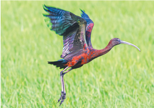
彩鹳起飞。