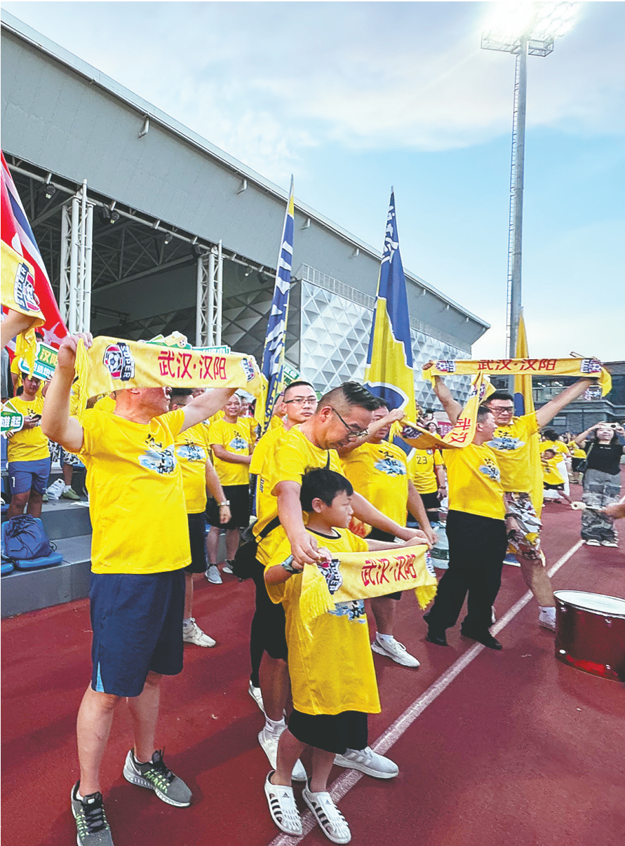
汉阳球迷方阵身着统一黄色上装。

当晚,汉阳区队在开局0比1的不利情况下,在第90分钟顽强扳平,将比赛拖入点球大战。最终汉阳区队以总比分5比3(点球4比2)上演惊天逆转,汉阳球迷不醉不归。