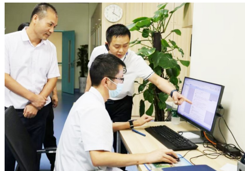
上级部门调研荆州市中心医院,检查检验结果互认工作。

从一纸报告互认,到万千患者减负,荆州以破壁之举诠释为民初心——当责任清单厘清模糊地带,当科技利器打通数据孤岛,降下去的是就医成本,升起来的是民生温度。那些省下的费用与奔波的时间,终将汇成百姓心头实实在在的获得感。