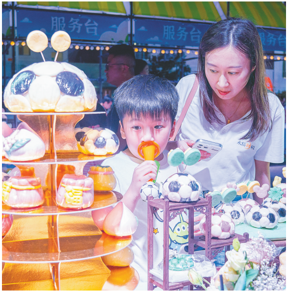
在「蹴鞠雅韵·李白市集」,足球造型的花馍深受游客欢迎。