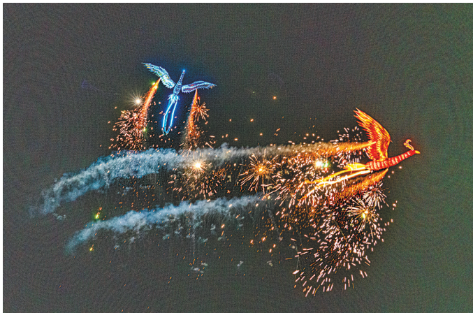
汉川市天屿湖旅游度假区举行「凤舞九天」飞行大秀。全媒记者 王欣 通讯员 蔡青阳 摄