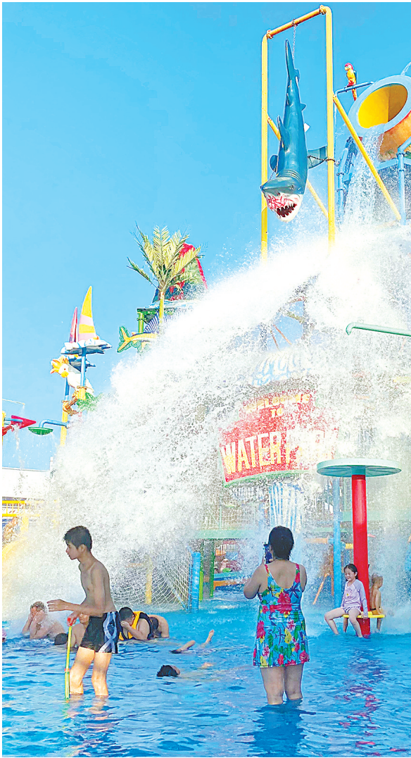
安陆市盛世闻樱景区水上乐园,游客乐享清凉。