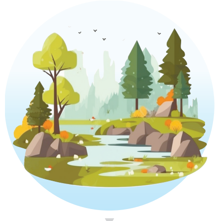
国家重要湿地 11处,总数居全国第1