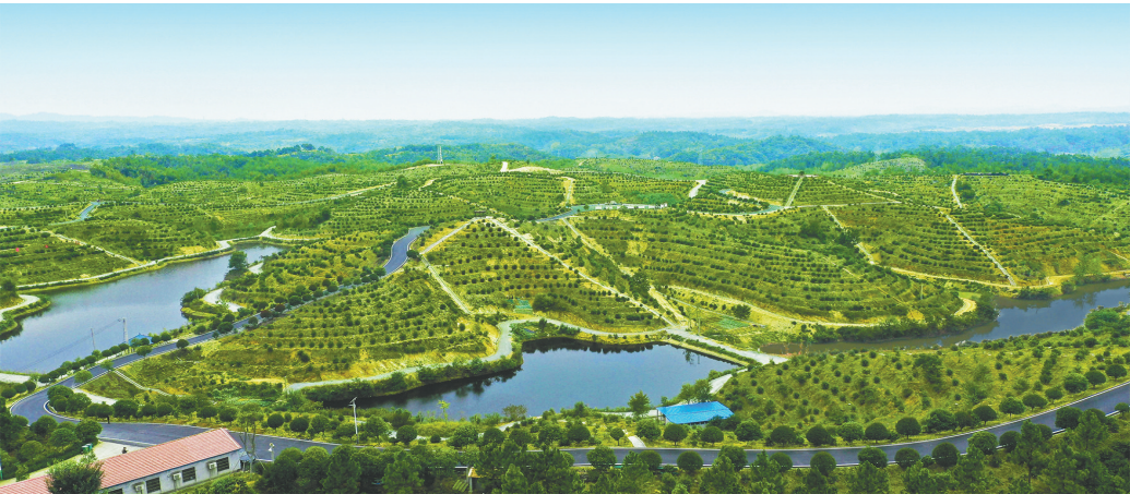
随县岳峰丰油茶基地。

人不负青山,青山定不负人。新征程上,湖北将深入践行“两山”理念,循着“三绿”并举、“四库”联动的路径,以提质、兴业、利民为导向,推进实施林业五大行动,构建森林生态屏障、林业要素保障、绿色产业支撑、网格化责任管理、现代林业治理等五大体系。这份执着,正为筑牢中部地区崛起的重要战略支点添绿赋能,为绘就美丽湖北新画卷注入源源不断的生机与活力。