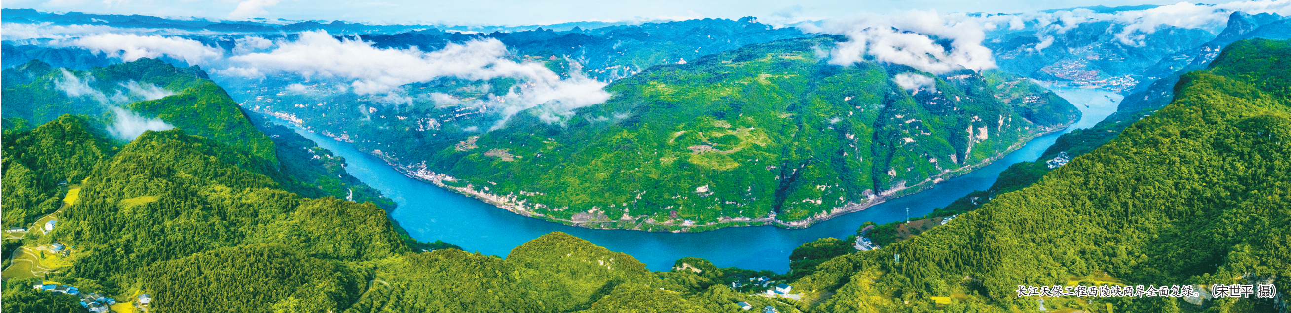
长江天保工程西陵峡两岸全面复绿。

以林为笔、以水为墨,深植“两山”理念,让林业保护与发展同频共振。如今,全省森林覆盖率从31.14%提升至42.45%,林业总产值从350.2亿元增长至5751.4亿元,水清岸绿间,江豚逐浪、麋鹿成群,生态画卷日日新。