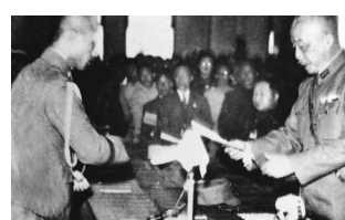
降儀式在台北中山堂舉行

1945年10月25日，中国战区台湾地区接受日军投降仪式在台北公会堂（现为“中山堂”）举行。日方代表安藤利吉在投降书上签字。