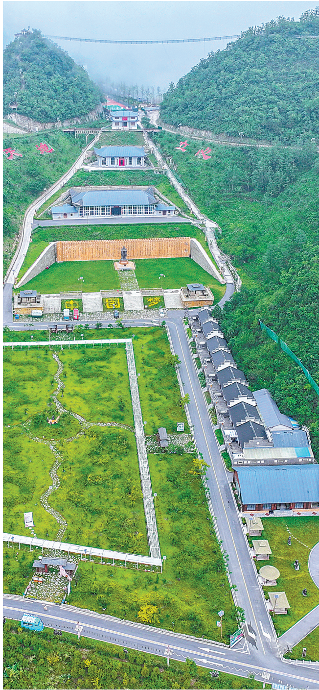
2024年,保康县黄龙观村六柱垭生态文化旅游区获评国家4A级景区。