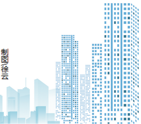
(湖北日报全媒记者 王婧 整理)