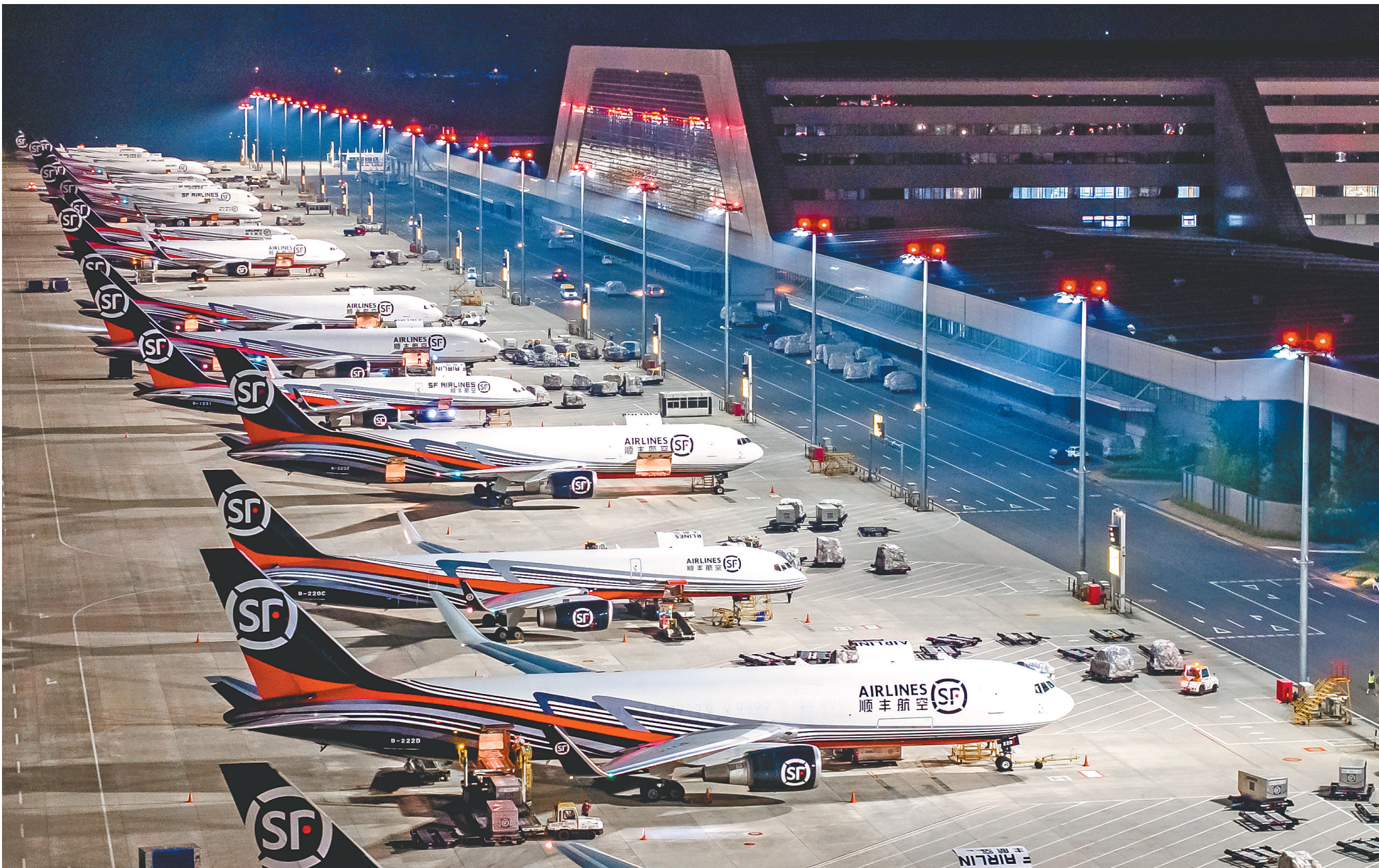
每天凌晨,鄂州花湖国际机场停机坪一片繁忙,几十架货机构成壮观的“雁阵”。