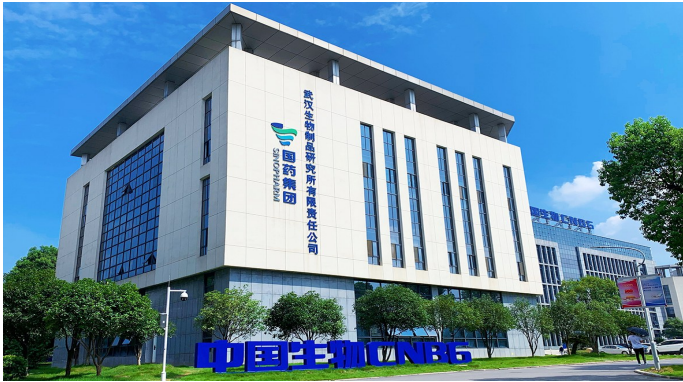
国药集团武汉生物制品研究所。