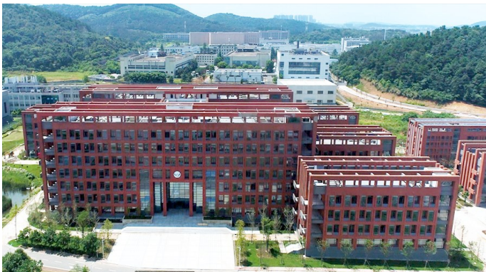
中科院武汉病毒研究所。