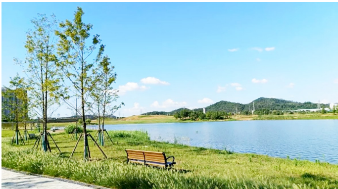
凤栖湖公园示范区绿化完工。