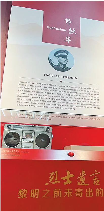
记录郭跃华遗言的磁带。