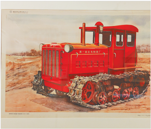
1950年代东方红拖拉机宣传画。