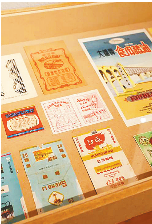
各类大桥牌产品包装纸。