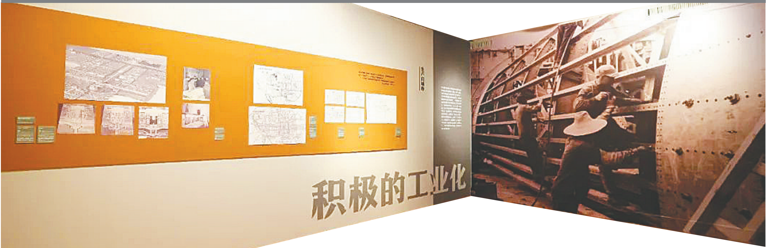
展览现场。