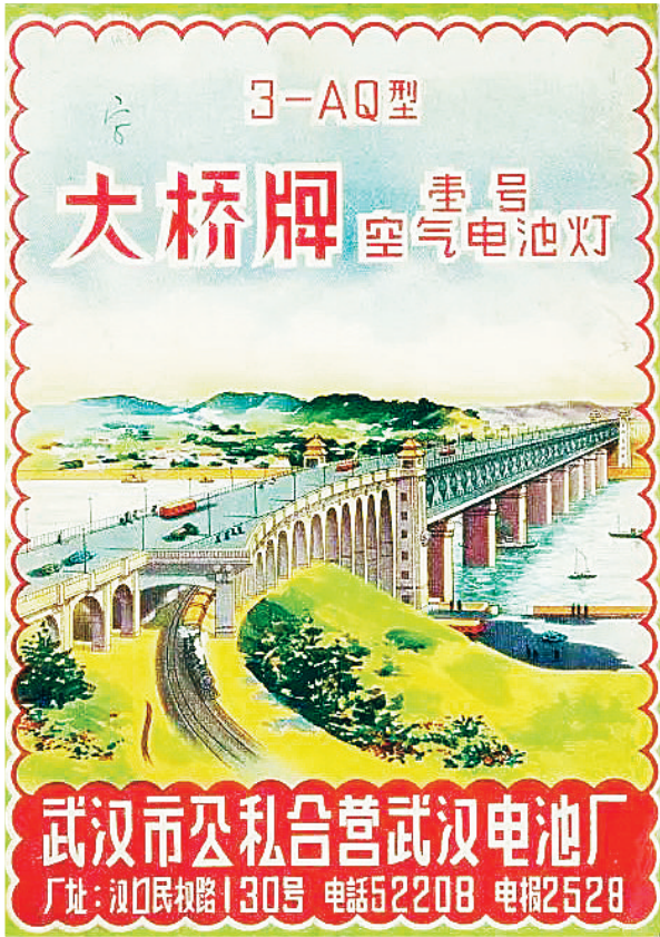
大桥牌壹号空气电池灯实物包装纸。

如果你问一个生活在上世纪50年代的武汉人,日常生活中印象最深的是什么?是工厂中昼夜不息的机器轰鸣,是山野间行驶于崎岖耕地上的拖拉机,还是家中随处可见的印着“大桥牌”商标的日用品?7月18日至8月17日,“新中国设计的诞生:艺术设计作品巡展”第二站在武汉美术馆(汉口馆)展出。该展览以中国社会的巨变为背景,围绕1945—1959年之间的中国设计与中国现代文明和历史文化之间的关系,通过300余件作品(包括实物、图像、影像和文献等多种载体),力求反映当年中国设计主体构建的历史路径。