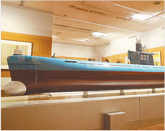
“6603”型潜艇模型。