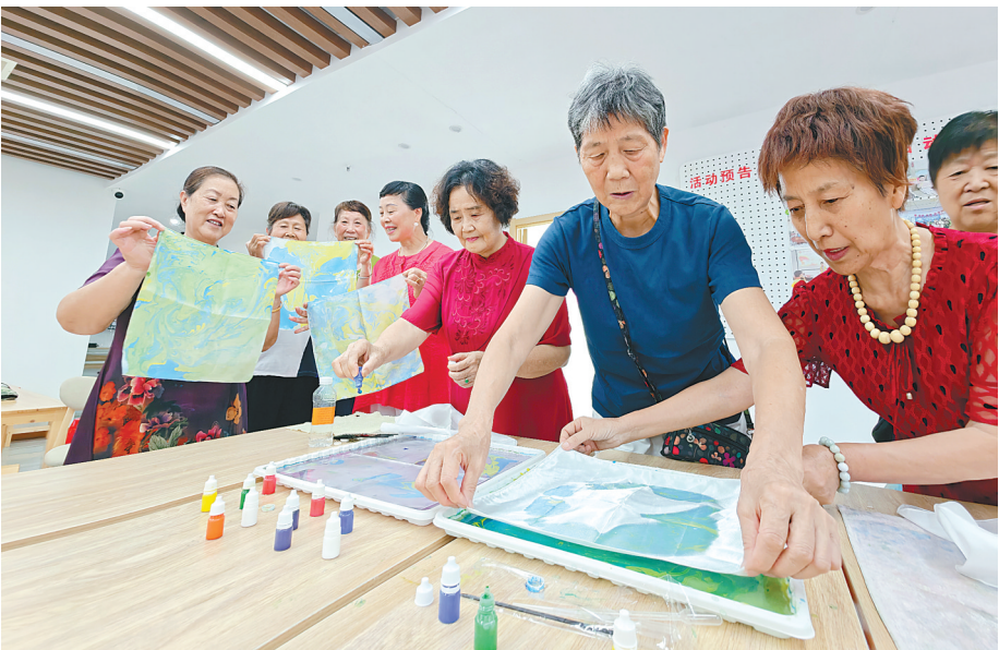
7月25日,武汉市东西湖区恋湖社区携手养老服务机构,为社区老人开展非遗拓印丝巾主题活动,给予老人心理慰藉。平日里,社区还组织器乐、京剧、唱歌等丰富活动。

第五届中国城乡老年人生活状况抽样调查显示,目前我国失能老年人约占全体老年人的11.6%,老年人患病率是总人口平均水平的4倍,带病生存时间达8年多。 调研发现,社区居家养老服务项目和实际服务能力与老年人需求不匹配,以满足自理老年人文化娱乐需求和提供助洁、助餐、咨询、探访等服务为主,未能有效满足老年人床前照护、就医等刚性需求。 条例草案对居家养老服务扶持政策、服务规范、医疗卫生服务向家庭延伸等作出规定:明确建立健全居家养老支持政策,完善上门服务基本规范,为老年人提供助餐、助医、助急、照护等专业化服务。探索建设家庭养老床位,将专业养老服务延伸至家庭。建立健全特殊困难老年人探访关爱制度,持续开展关爱服务。推动医疗卫生服务向家庭延伸,健全老年家庭医生签约服务制度,健全居家医疗服务价格政策。 “医是医,养是养”,“医”与“养”隔山隔水的现实矛盾成为养老服务中亟待破解的一段“肠梗阻”。 调研发现,医养结合工作协同机制不健全,部分地方卫健、民政、医保工作存在“三张皮”,“医养一张床、换模式不换床”按需转换机制还未完全实现,与基层和群众关于“不折腾老人、不折腾家属、不折腾机构”的期盼还有较大差距。此外,还存在