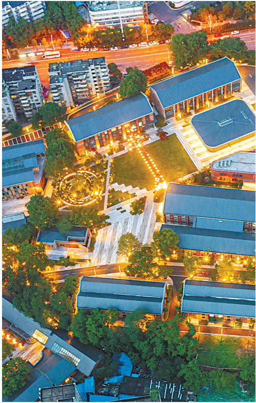
▲华中中小龟山金融文化公园 2021年开园,目前已吸引60余家金融相关机构入驻。