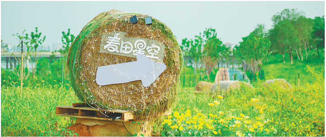
小麦收割后,秸秆被制作成一个一个“瑞士卷”草垛。