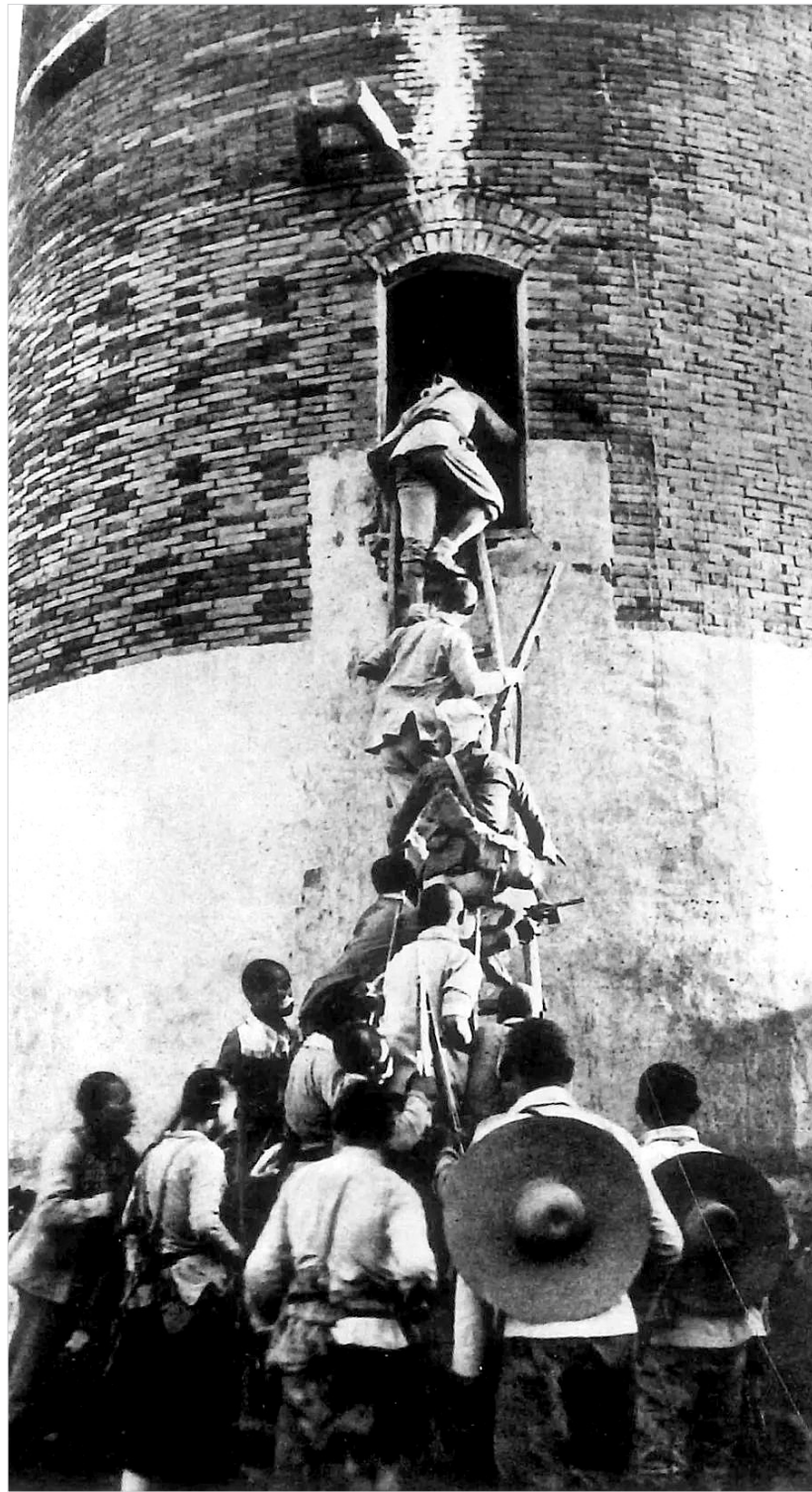
我军拔除敌军据点。