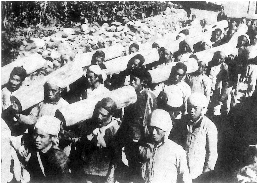
民兵扛着土制的木炮。