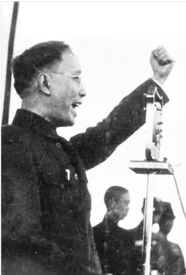
时任第三厅厅长郭沫若为献金运动发表动员演讲。