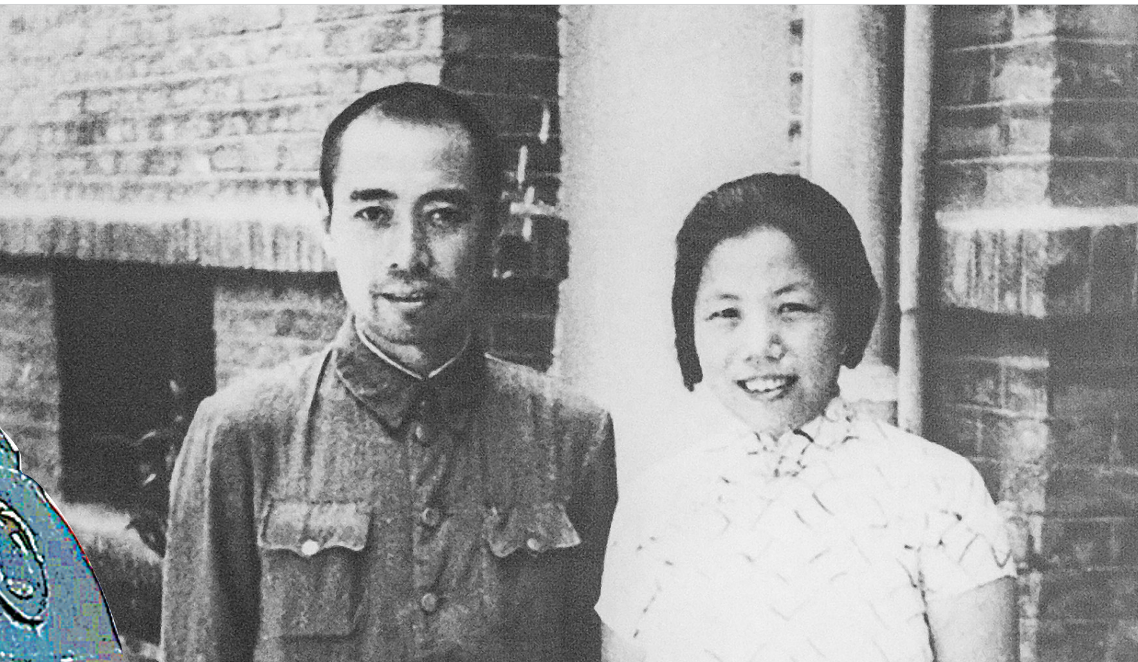
周恩来、邓颖超夫妇在珞珈山寓所前合影(翻拍)。