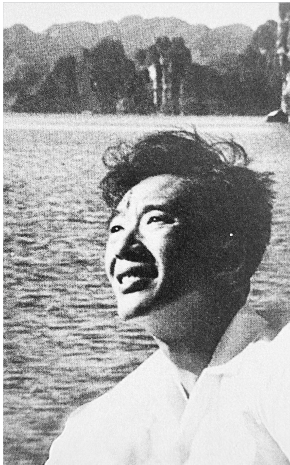
老河口市光未然小学展示的光未然青年时期的照片。