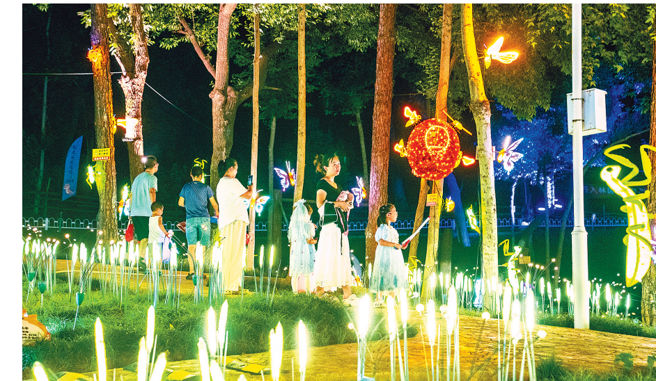
7月19日傍晚，武汉九峰森林动物园，游客在光影绚丽的园区与小动物互动，欣赏奇幻光影秀。夜幕降临，压轴的极光夜宴上演，园区化身成为光影构筑的“梦幻空间”，极光特效交织出如梦似幻的场景，全场氛围达到高潮。

入夏以来，主隧洞掘进已超8.3公里，支洞掘进已超25.2公里，建设进度条不断刷新。