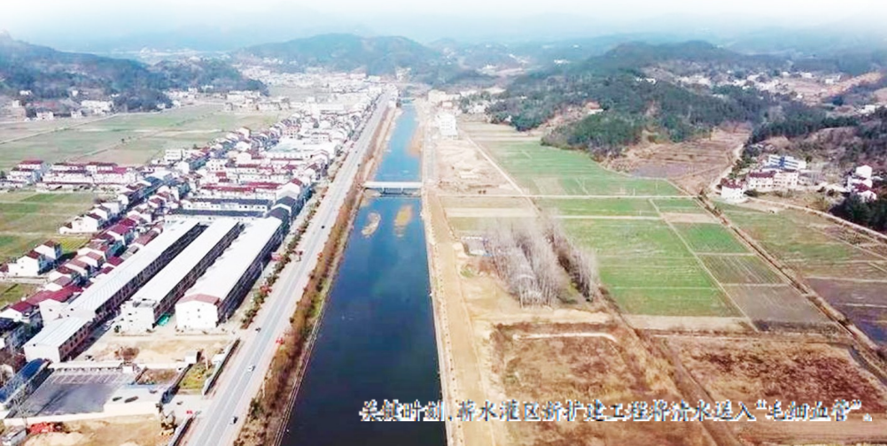
宜昌引江补汉工程将推进工程管涌水注入“毛细血管”。

锚定“支点建设”再出发，农发行湖北省分行将持续弘扬“大别山精神、抗洪精神、抗疫精神”三大精神，服务“三农”，勇争一流，以拼的状态、比的劲头、实的作风，以更强劲的金融脉动，夯实湖北高质量发展稳增长的“压舱石”。（秦国文 刘爱迪 陈韵）