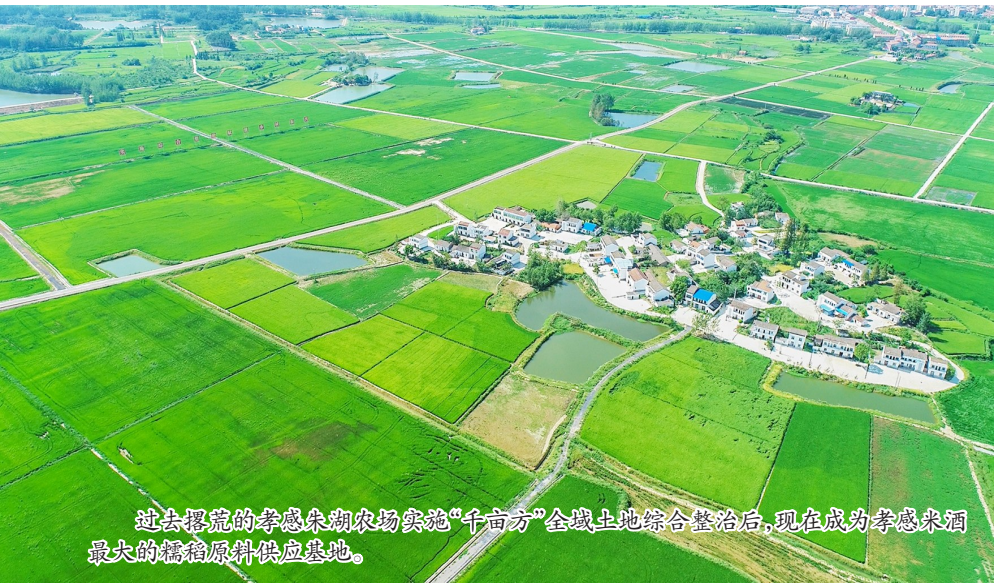
过去挖藕的孝感朱湖农场实施“千亩方”全链土地综合整治后，现在成为孝感米酒最大的糯稻原料供应基地。

渥”所困。在核心产区朱湖农场等地，“巴掌田”“斗笠田”星罗棋布，耕地碎片化导致产能低下。尽管当地早有将“朱湖糯米”打造成金字招牌的愿景，却因综合整治项目规模大、周期长、投入高，推进之路步履维艰。