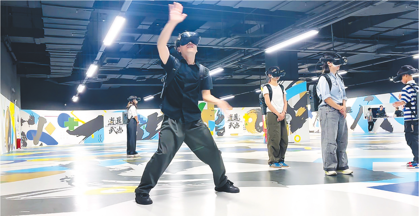
「逍遥武当」体验区内,游客沉浸在虚拟现实之中。

道……人在现实里每走一步,VR空间的数字分身也等比例地走一步。爬楼梯时,还能感到左右晃动,就像在走真实的山路。