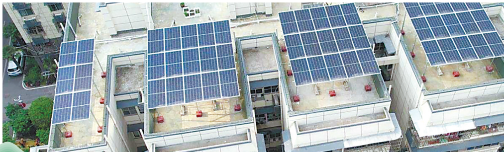
江汉区北湖街道新华小区的屋顶光伏。

北湖街道地处江汉区新老城区的交会地带，总面积1.78平方公里。2023年3月，北湖街道成功入选“C40绿色繁荣社区项目”试点，成为华中地区唯一的试点项目。两年来，北湖街道在公共机构能源托管、居民小区低碳化改造、绿色消费、二手物品循环利用、低碳产业发展等方面进行试点示范，积极探索中心城区繁华街道近零碳解决方案，取得较好效果。