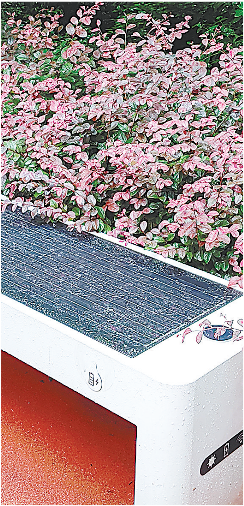
新华小区内集成光伏板、USB接口、蓝牙音响等多功能的光伏凳。