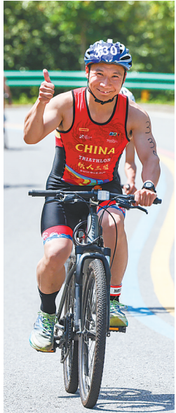
4月26日，参加乡村铁人三项公开赛的选手正在进行自行车比赛。