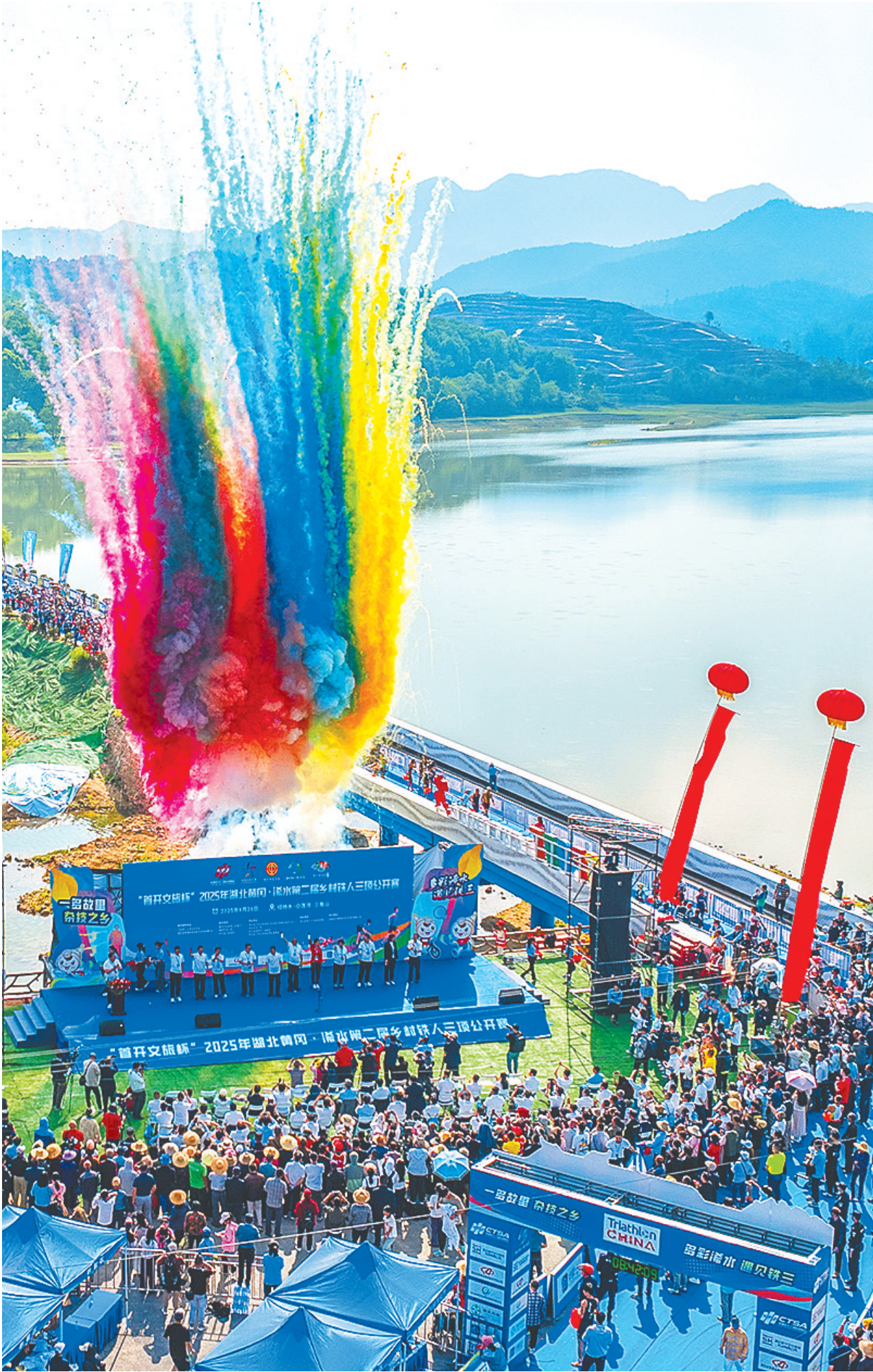
4月26日，浠水县绿杨乡，浠水第二届乡村铁人三项公开赛激情开赛。