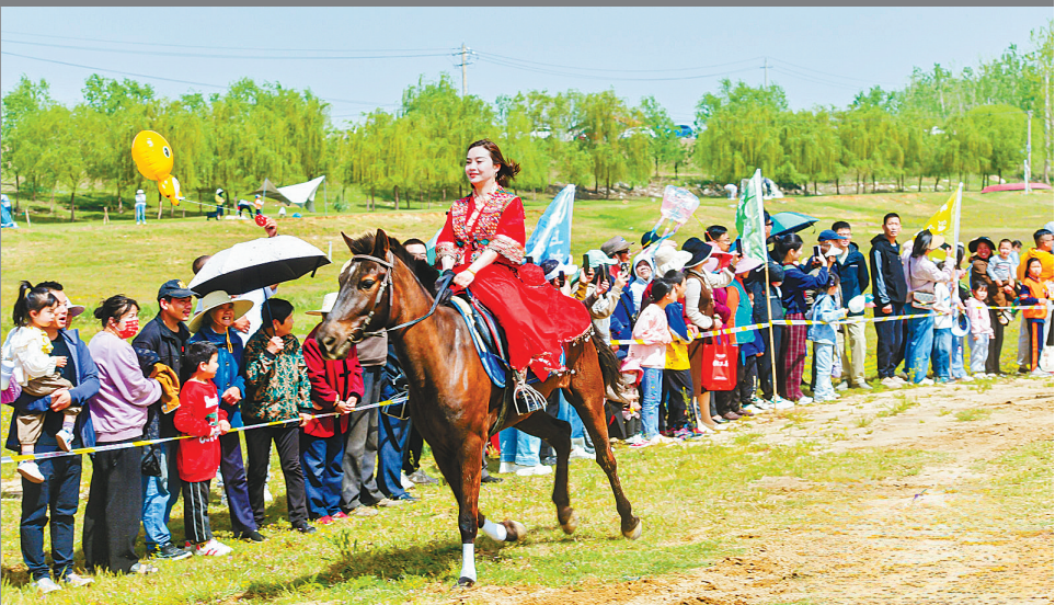
紫云英踏青文化节推出的“骑乐无穷”马术表演。

“体育+”的裂变效应，更在赛场外激荡。罗田以马拉松赛事为媒送出价值400万元的景区“请柬”，黄州花海带动农家乐日入万元，浠水“铁三”赛道化身乡村旅游“金腰带”。一场赛事激活一条产业链，“流量密码”背后，是绿水青山向金山银山的创新转化。 从马拉松到铁人三项，从自行车赛到村BA，黄冈正以“体育+”为支点，撬动全域文旅资源。当运动之美与山水之韵、人文之魂深度交融，这张新“请柬”上，写满了大别山下的澎湃春意。