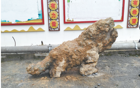
图为叠层石化石。

陈小龙表示,继此前发现的三叶虫化石和夹壁村遗迹化石之后,此次叠层石的发现是毛坝镇古生物化石研究领域的又一突破,进一步丰富了毛坝镇古生物化石的种类,具有重要的科研价值和地质意义。