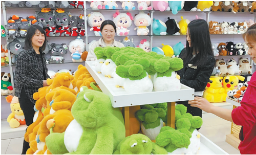
批发商正在汉口北金沙娃娃玩具礼品店选购“蒜鸟”。

“武汉‘蒜鸟’的爆火,是地方文化与现代消费结合的绝佳案例,它不仅是纪念品,更是一种文化IP符号,游客通过它把武汉记忆带回家。”湖北省社科院经济研究所助理研究员李非非认为,“蒜鸟”既接地气又充满幽默感,还体现了武汉人豁达、包容的性格,能提供缓解生活压力的“温暖情绪价值”,从侧面反映出广大年轻人对美好生活的期许。