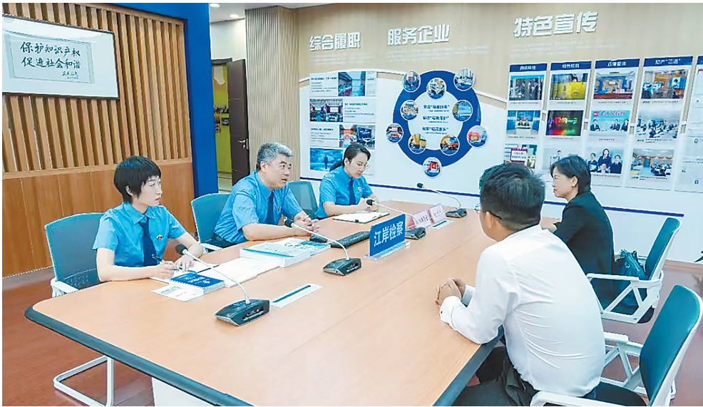
一起侵犯商业秘密案被害公司的代表来到武汉市江岸区检察院，感谢该院“知岸检行”团队依法维护该公司合法权益。

职，严把法律政策界限，切实维护新兴行业、企业的合法权益。同时，注重从个案监督向类案监督延伸，类案监督撤案128人，监督返还涉案财产超过2700万元。