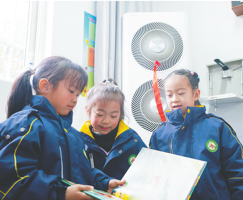
云梦县吴铺镇的黄香小学三湖校区新安装了29台空调,小学生们在暖和的教室里开心地学习、玩耍。