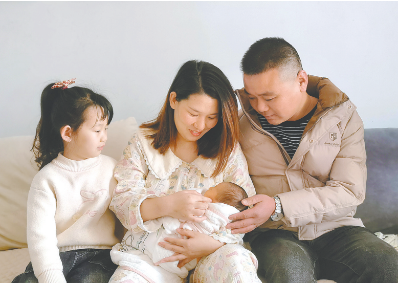
“元旦宝宝”降临,苏鹏一家四口其乐融融。