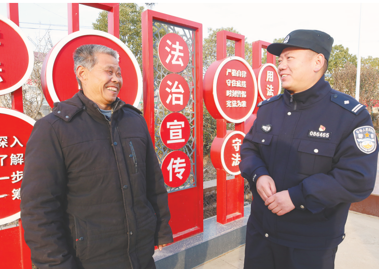
孝昌县公安局卫店派出所民辅警在卫店社区回访群众,开展法治宣传教育。