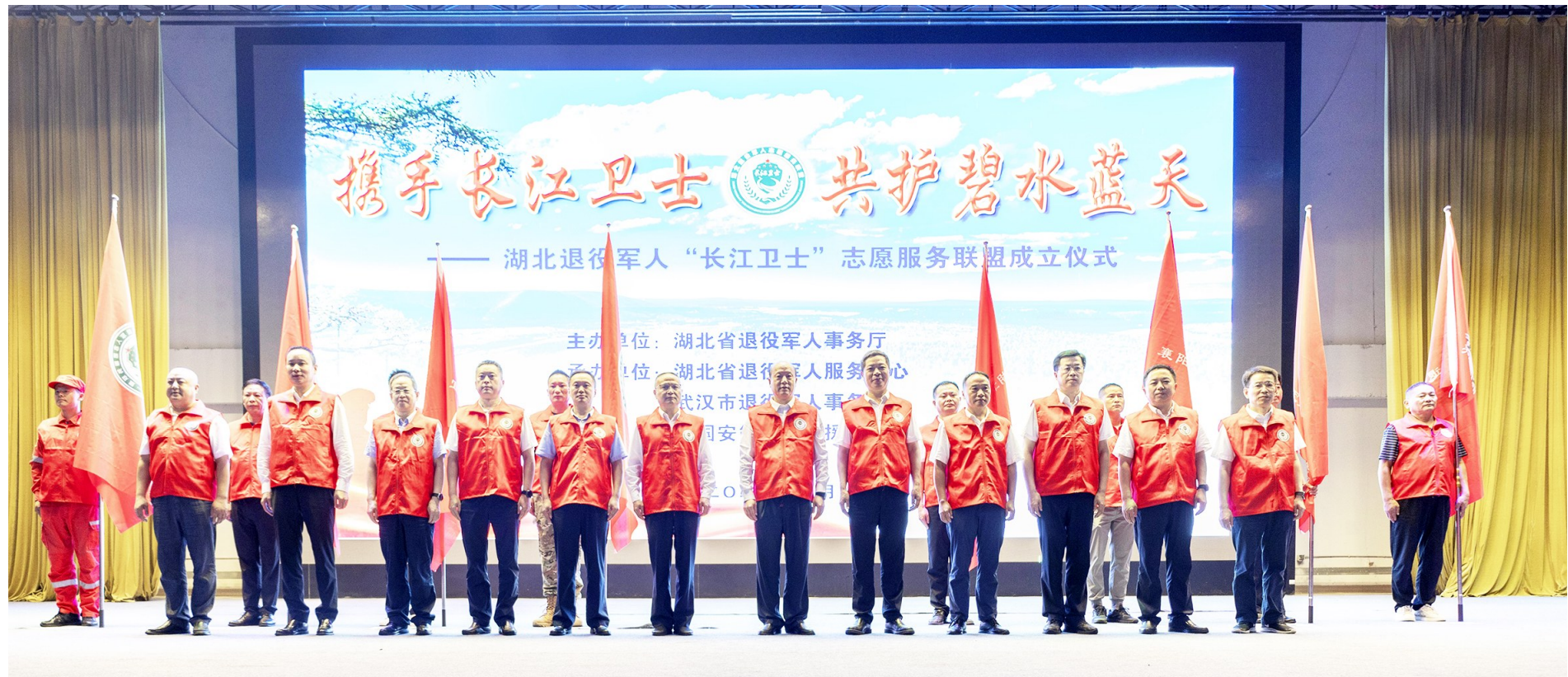
2024年8月1日,湖北退役军人“长江卫士”志愿服务联盟在武汉成立。

近年来,在武汉市委、市政府坚强领导下,在湖北省退役军人事务厅悉心指导下,武汉市退役军人事务局认真落实退役军人服务保障体系建设“五有”“全覆盖”要求,积极打造“幸福兵站集结号”工作品牌,推进服务保障体系从有到优转变,实现与退役军人“五强之地”的双向奔赴,奋力谱写中国式现代化湖北篇章。