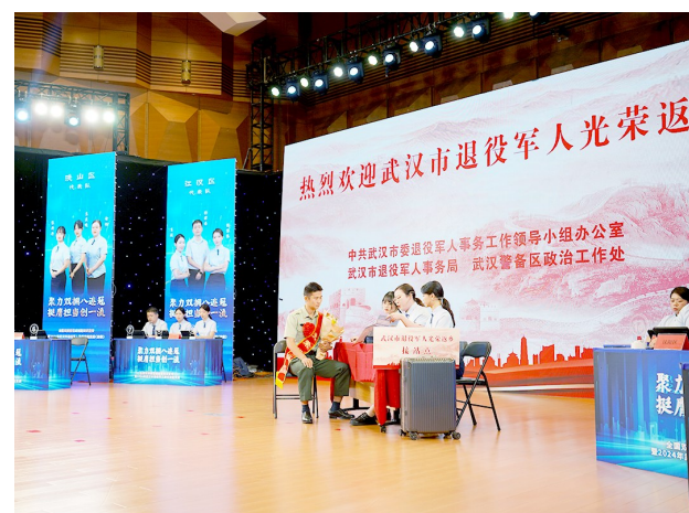
迎接返乡退役军人场景搬上2024年武汉市退役军人服务技能竞赛赛场。