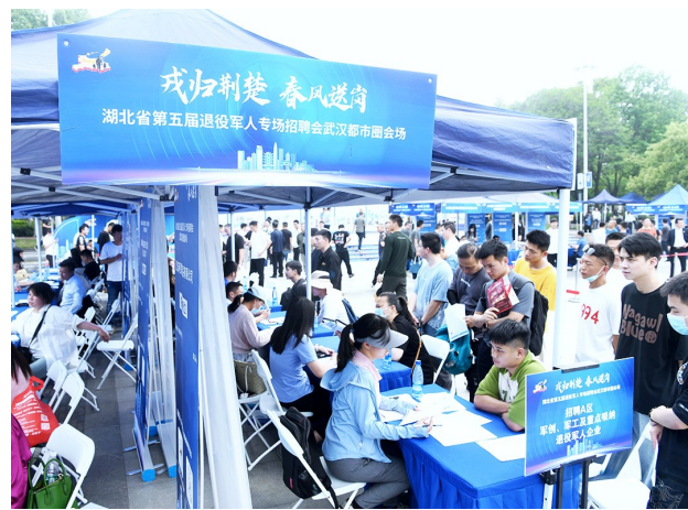
湖北省第五届退役军人专场招聘会武汉都市圈会场。