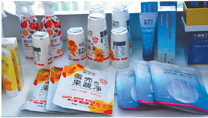
依靠科技研发,废弃蛋壳吃干榨尽,开发出20余种新产品,深受市场欢迎。