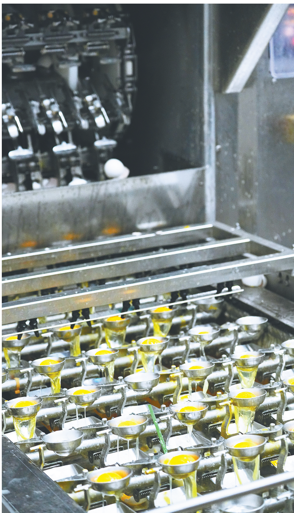
自动化设备将鸡蛋打开,分离蛋清和蛋黄。蛋清被收集并进一步加工,以提取其中溶菌酶。