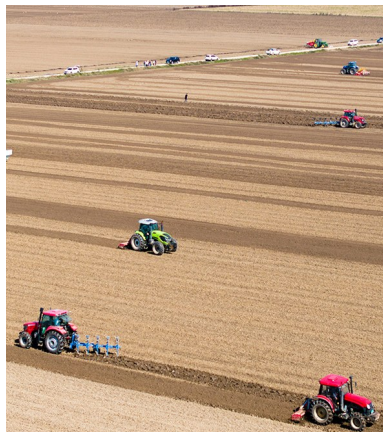
小田变大田,让机械化大显身手。