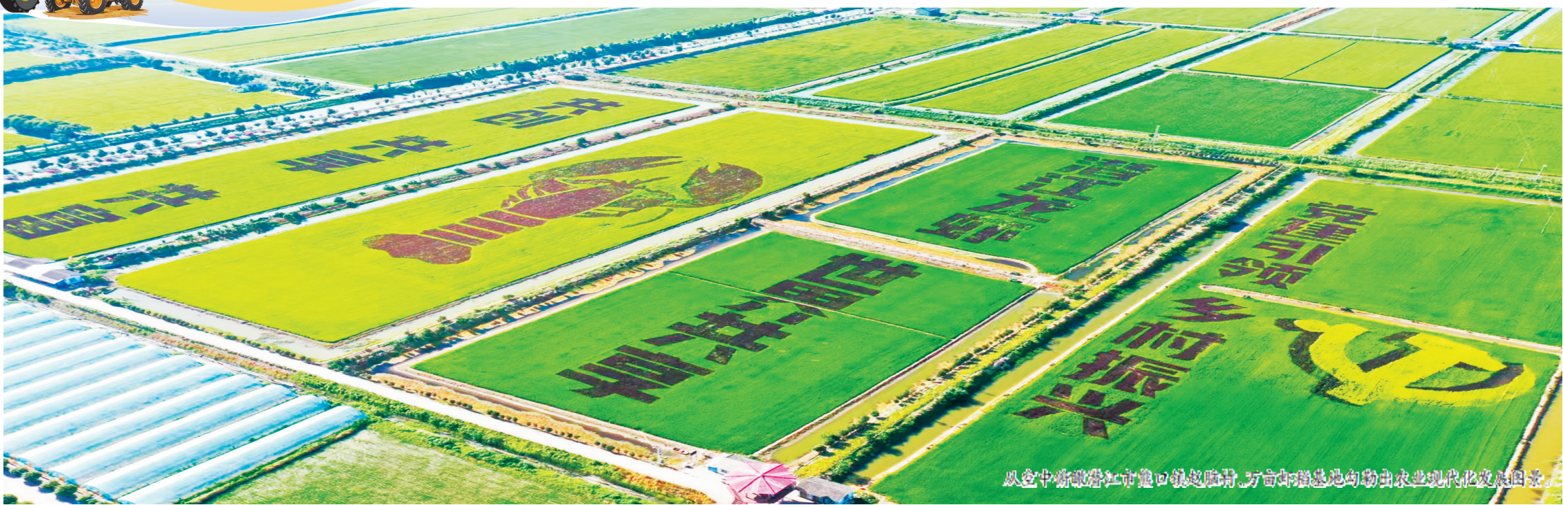
从空中俯瞰潜江市汉江口镇赵脑村,万亩高标准农田勾勒出现代农业发展图景。