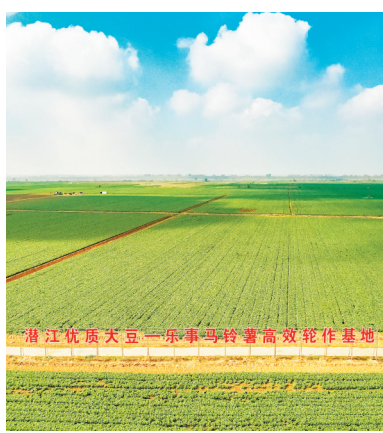
潜江市竹根滩镇沙街村汉江大堤外的滩地变成沃野良田。

潜江市除了采取出动宣传车、拉挂横幅、印发宣传资料等方式外,还采取耕地整改学习拉练,组织党员群众在田间地头座谈、开“板凳会”“湾组会”等拉家常的方式宣讲耕地保护和粮食安全相关政策,营造人人参与的耕地保护良好氛围。