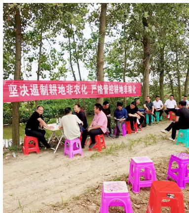
潜江市渔洋镇鄢岭村在田间地头开展耕地保护宣传。

“今年将继续推进问题整改,确保年底耕地总量动态平衡。截至目前,我市已新增耕地1万余亩。”潜江市自然资源部门相关负责人介绍,潜江市耕地保有量为181.5003万亩,永久基本农田面积153.224万亩,全面超额完成国家下达的耕地保护任务,去年全市粮食总产量达12.08亿斤,粮食种植面积、单产、总产实现“三增长”。