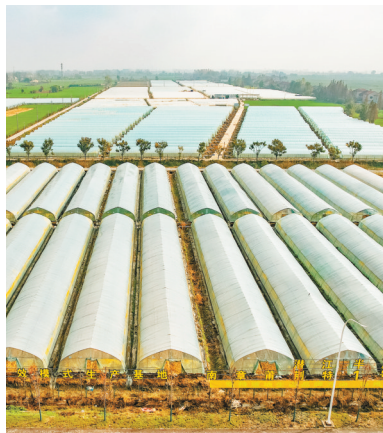
高石碑镇充分利用全域国土整治项目,全面完善客岭村基础设施建设,吸引企业流转土地发展农业种植。