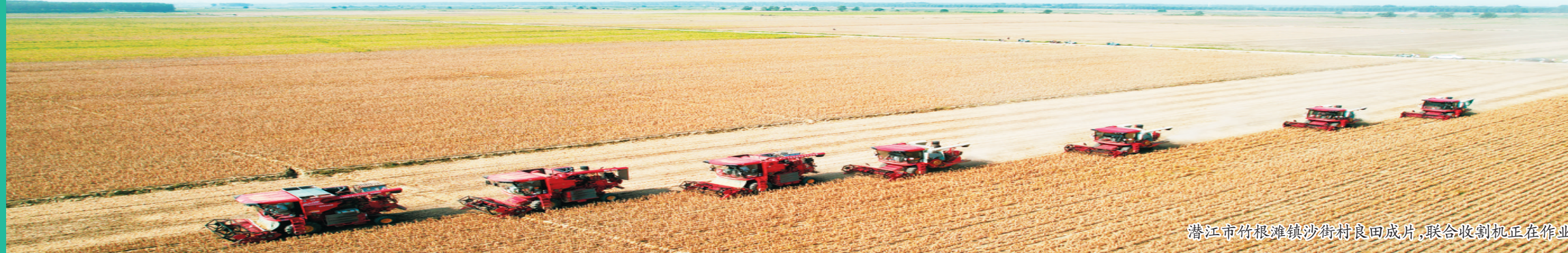
潜江市竹根滩镇沙街村良田成片,联合收割机正在作业。

新形势需要新作为,新任务需要新举措。潜江市自然资源部门将持续采取“长牙齿”的硬措施,严格落实耕地保护目标责任,积极构建耕地保护新机制新格局,真正把有限的土地资源用在服务高质量发展上,为“中国饭碗”装“中国粮”贡献潜江力量。