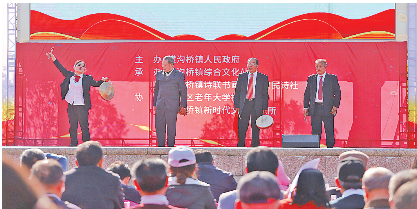
农民诗人表演三句半。

海棠结社，菊花赋诗，像大观园里公子小姐们那般雅集赛诗；横沟桥镇的诗联大赛已连办了十届，而他们的农民诗社则已成立了十六载，300余农民诗人活跃在这片热土。