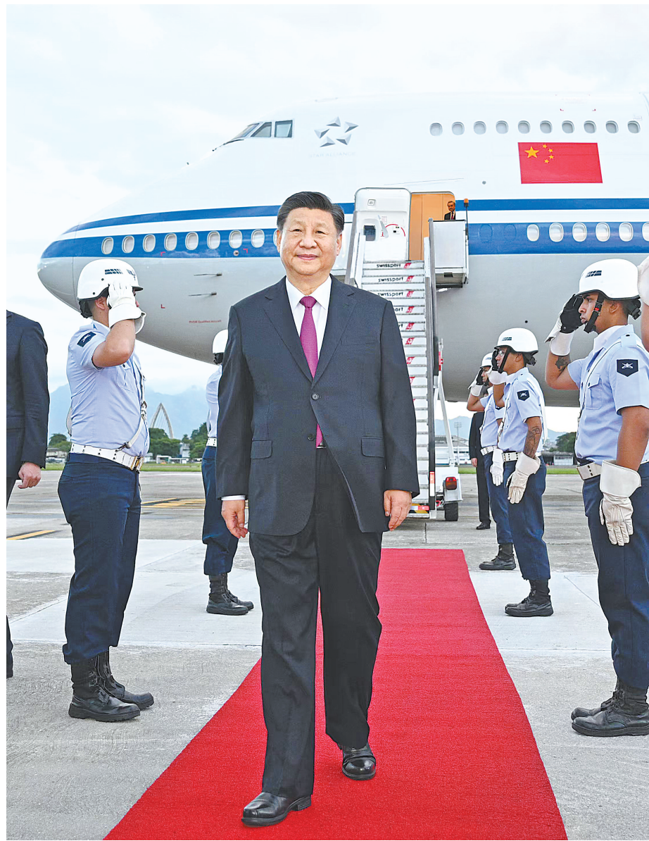
当地时间11月17日下午,国家主席习近平乘专机抵达里约热内卢,应巴西联邦共和国总统卢拉邀请,出席二十国集团领导人第十九次峰会并对巴西进行国事访问。

新华社里约热内卢11月17日电 当地时间11月17日下午,国家主席习近平乘专机抵达里约热内卢,应巴西联邦共和国总统卢拉邀请,出席二十国集团领导人第十九次峰会并对巴西进行国事访问。 专机抵达里约热内卢加里昂空军基地时,巴西政府高级官员热情迎接。巴西空军号手吹号致敬,礼兵分列红毯两侧。 习近平发表机场书面讲话,向巴西政府和巴西人民致以诚挚问候和良好祝愿。 习近平指出,我曾4次到访巴西,亲眼见证了巴西近30年来的发展变化,再次踏上这片热情的土地,我倍感亲切。中国和巴西是志同道合的好朋友、携手