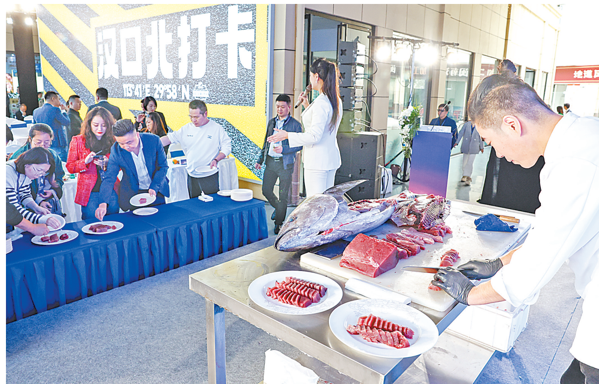
11月13日,由东南亚名厨现场烹饪的美食,吸引了不少市民排队拍照品尝。图为市民嘉宾现场品尝金枪鱼。