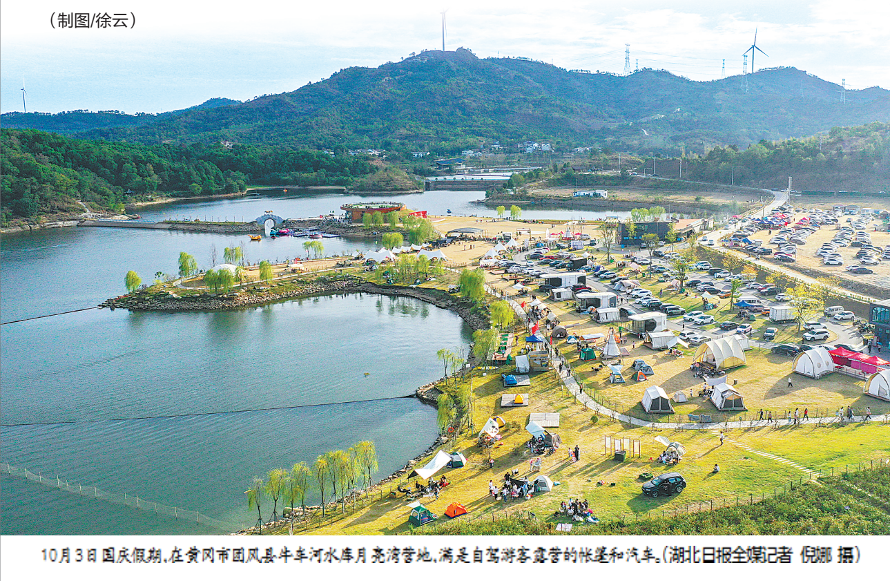
10月3日国庆假期,在黄冈市团风县牛车河水库月亮湾营地,满足自驾游客露营地帐篷和汽车。

全体公民放假的假日,可合理安排统一放假调休 除个别特殊年节外,法定节假日假期前后连续工作一般不超过6天