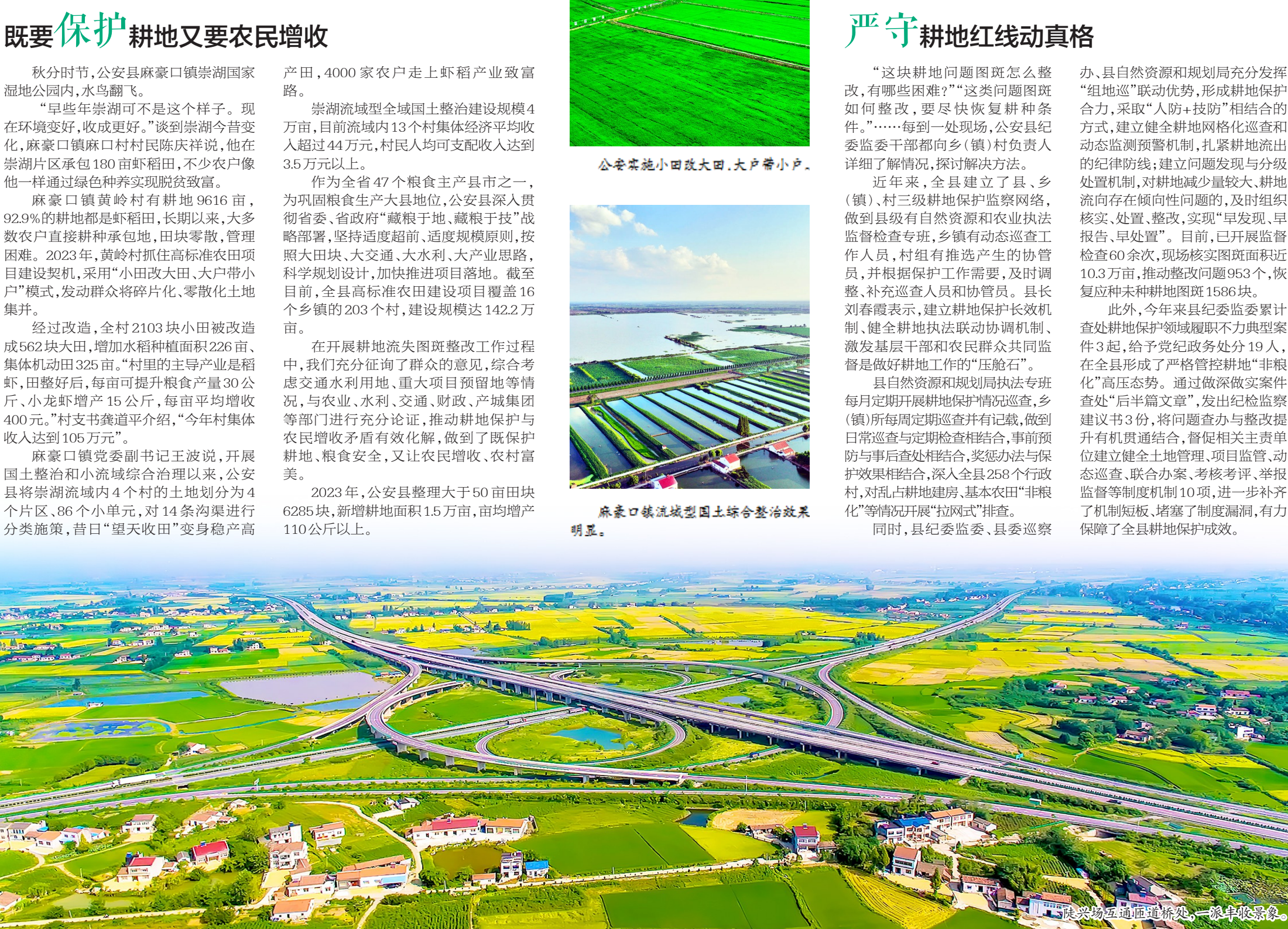
隆兴场互通匝道桥处,一派丰收景象。

“这块耕地问题图斑怎么整改,有哪些困难?”“这类问题图斑如何整改,要尽快恢复耕种条件。”……每到一处现场,公安县纪委监委干部都向乡(镇)村负责人详细了解情况,探讨解决方法。 近年来,全县建立了县、乡(镇)、村三级耕地保护监督网络,做到县级有自然资源和农业综合执法监督检查专班,乡镇有动态巡查工作人员,村组有推选产生的协管员,并根据保护工作需要,及时调整、补充巡查人员和协管员。县长刘春霞表示,建立耕地保护长效机制,健全耕地执法联动协调机制、激发基层干部和农民群众共同监督是做好耕地工作的“压舱石”。 县自然资源和规划局执法专班每月定期开展耕地保护情况巡查,乡(镇)所每周定期巡查并有记载,做到日常巡查与定期检查相结合,事前预防与事后查处相结合,奖惩办法与保护效果相结合,深入全县258个行政村,对乱占耕地建房、基本农田“非粮化”等情况开展“拉网式”排查。 同时,县纪委监委、县委巡察办、县自然资源和规划局充分发挥“组地巡”联动优势,形成耕地保护合力,采取“人防+技防”相结合的方式,建立健全耕地网格化巡查和动态监测预警机制,压紧耕地流出的纪律防线;建立问题发现与分级处置机制,对耕地减少量较大、耕地流向存在倾向性问题的,及时组织核实、处置、整改,实现“早发现、早报告、早处置”。目前,已开展监督检查60余次,现场核实的图斑面积近10.3万亩,推动整改问题953个,恢复应种未种耕地图斑1586块。 此外,近年来县纪委监委累计查处耕地保护领域履职不力典型案例3起,给予党纪政务处分19人,在全县形成了严格管控耕地“非粮化”高压态势。通过做深做实案件查处“后半篇文章”,发出纪检监察建议书3份,将问题查办与整改提升有机结合,督促相关责任单位建立健全土地管理、项目监管、动态巡查、联合办案、考核考评、举报监督等制度机制10项,进一步补齐了机制短板、堵塞了制度漏洞,有力保障了全县耕地保护成效。