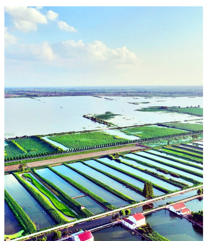
麻豪口镇流域型国土综合整治效果明显。