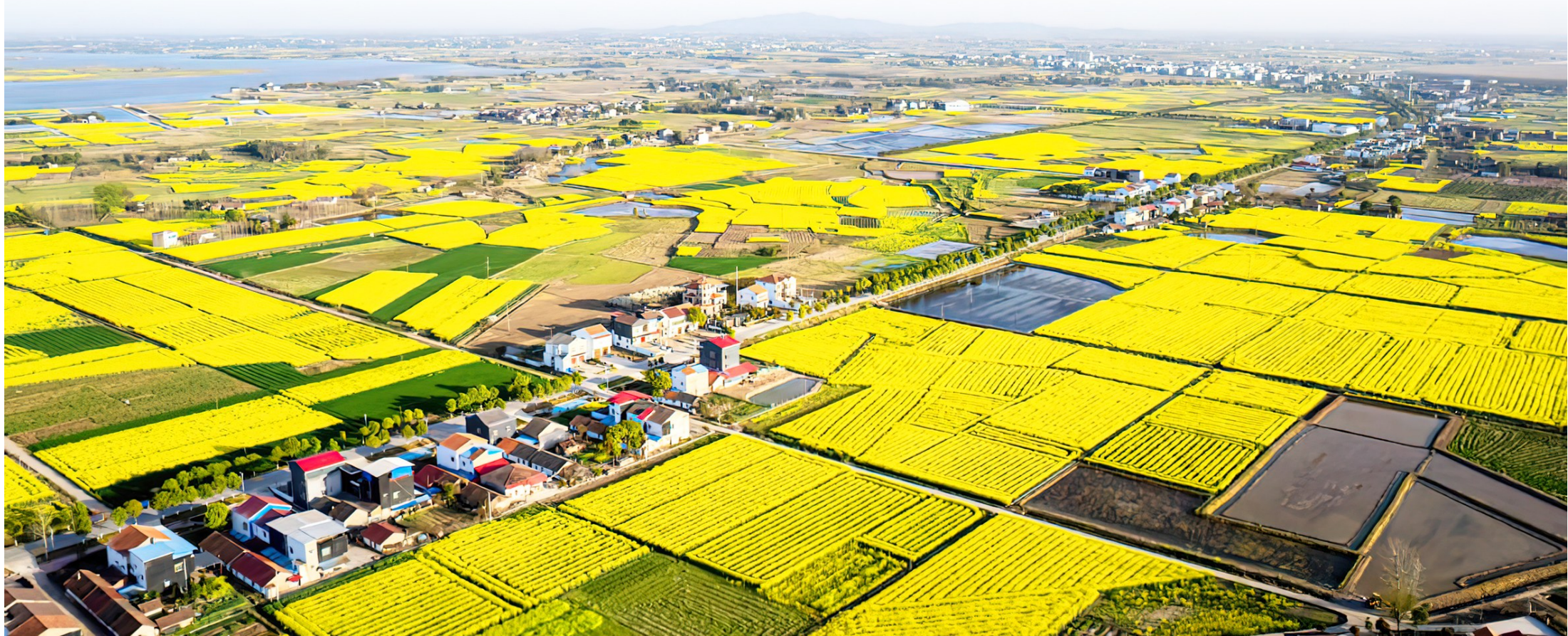
放眼望去,尽是金黄。