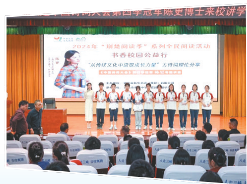
4月22日,宜昌市新华书店特邀《中国诗词大会》第四季总冠军陈更博士来宜,开展以“从传统文化中汲取成长力量”为主题的讲座活动。

今年1月,湖北省新华书店集团在全国出版发行行业率先启动了助力首批书香校园示范区试点工作,目前已与省内9个地区共建书香校园示范区。该集团通过这一举措,探索创新推动阅读服务、做深做透教育服务的新路径。