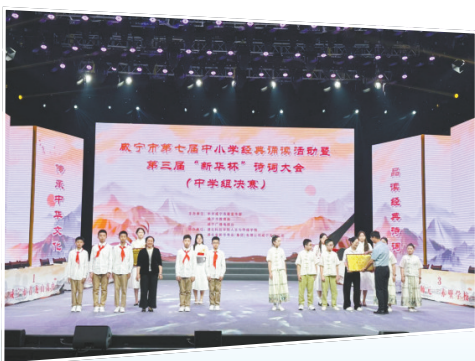
5月30日,咸宁市新华书店承办第七届中小小学经典诵读活动暨第三届“新华杯”诗词大赛。