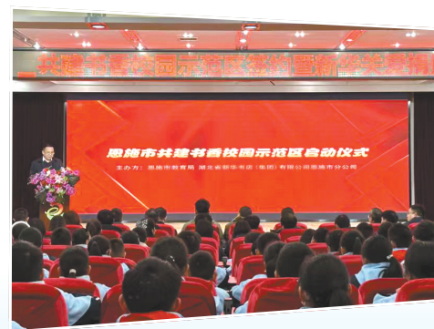
1月,恩施州新华书店与恩施市教育局在恩施市实验小学举行恩施市共建书香校园示范区启动仪式。