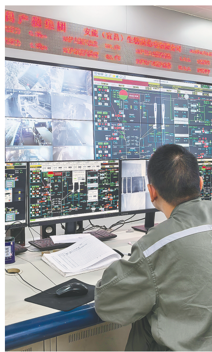
宜昌安能的控制室正在运转。