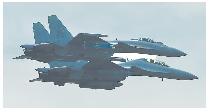
11月9日,海军歼-15系列舰载机编队在广东珠海进行适应性飞行训练。