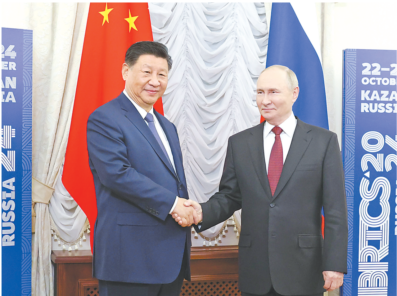
当地时间10月22日下午,国家主席习近平在喀山克里姆林宫同俄罗斯总统普京举行会晤。

新华社俄罗斯喀山10月22日电 当地时间10月22日下午,国家主席习近平在喀山克里姆林宫同俄罗斯总统普京举行会晤。 习近平指出,今年是中俄建交75周年。75年来,中俄关系风雨兼程,探索出“不结盟、不对抗、不针对第三方”的相邻大国正确相处之道。双方秉持永久睦邻友好、全面战略合作、互利合作共赢精神,不断深化和拓展全面战略协作和各领域务实合作,为推动两