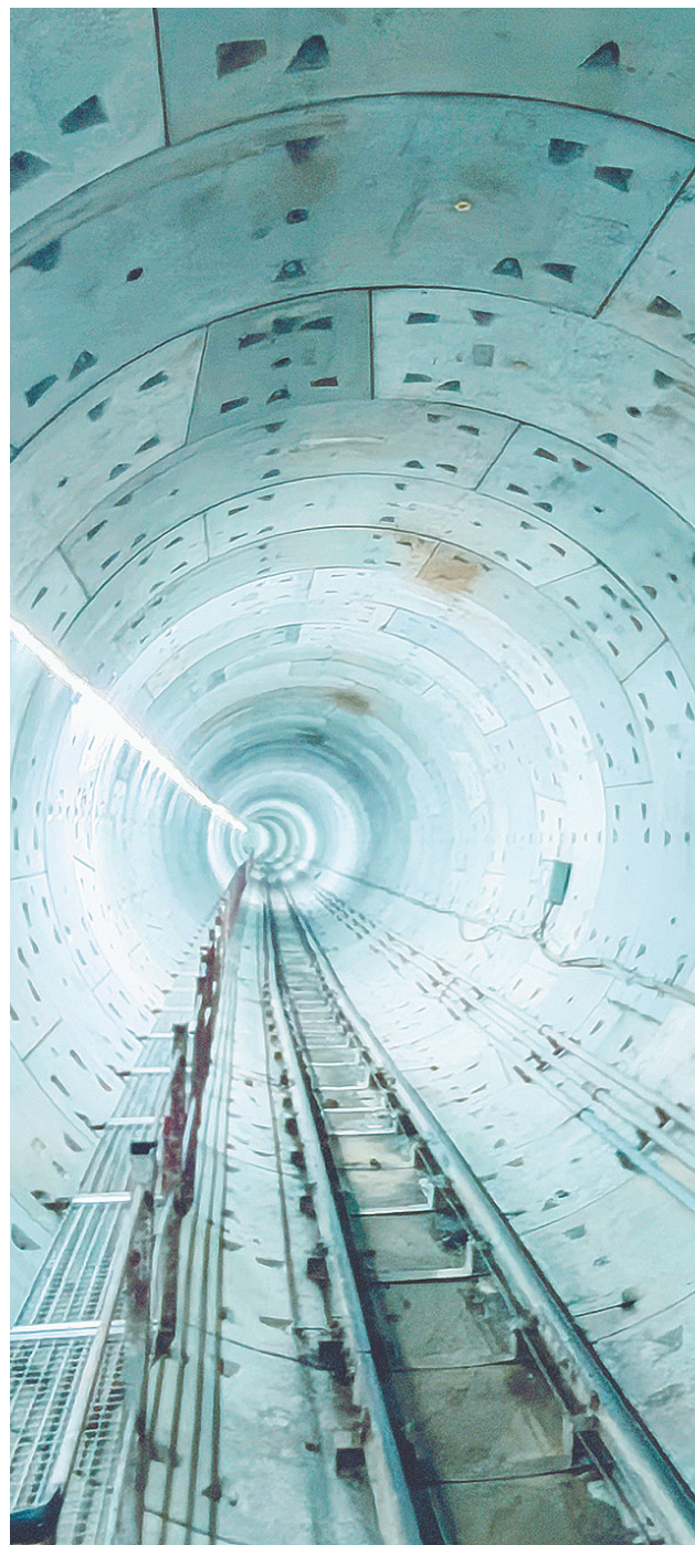
武汉地铁12号线3标段盾构完成后成型的隧道。

湖北日报讯(记者成熔兴、通讯员曾斯、袁永华、张岩)10月22日,武汉地铁12号线传来喜讯:随着四新南路站—四新中路站区间左线区间的盾构机破壁而出,3标段成为地铁12号线首个双线贯通的标段。