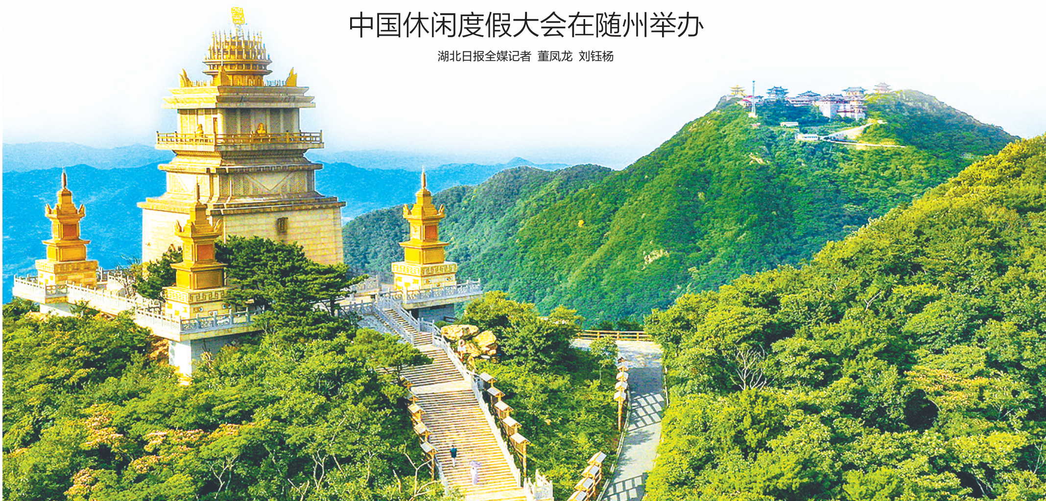
远眺大洪山休闲度假区。