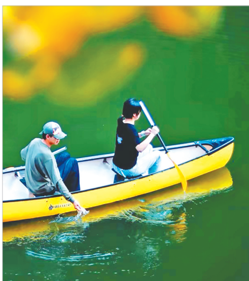
曾都区银杏谷度假区的“大乐之野”民宿，游客正在湖上划船。