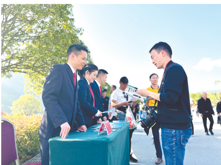
恩施市法院大峡谷风景区法庭干警开展普法宣传。

在执行过程中注意用好“活封”“活扣”、执行和解等措施，完善财产自行处置、财产处置宽限期等机制；创新被执行人信用预警和修复机制，在将被被执行人纳入失信名单前，先书面预警、督促履行，被执行人履行完毕后，为其开具信用修复证明；深入推进“执破融合”，注重多和解、多重整、少清算，化解涉企债务纠纷，挽救困难企业，活跃市场交易。