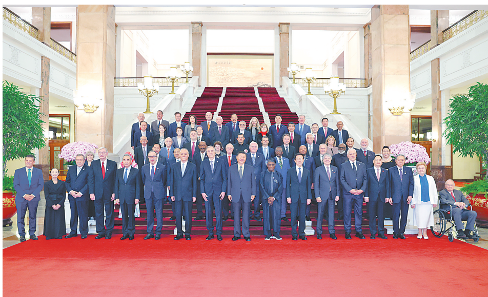
10月11日上午,国家主席习近平在北京人民大会堂集体会见出席中国国际友好大会暨中国人民对外友好协会成立70周年纪念活动的外方嘉宾。这是习近平同部分外方嘉宾代表合影留念。

新华社北京10月11日电 10月11日上午,国家主席习近平在北京人民大会堂集体会见出席中国国际友好大会暨中国人民对外友好协会成立70周年纪念活动的外方嘉宾。 习近平首先同来华出席中国国际友好大会暨中国人民对外友好协会成立70周年纪念活动的部分外方嘉宾代表